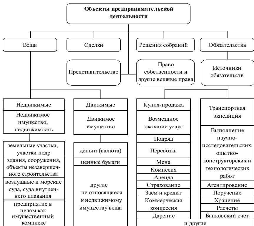
Рис. 1.3. Объекты предпринимательской деятельности

К движимому имуществу относятся «вещи, не относящиеся к недвижимости, включая деньги и ценные бумаги. Регистрация прав на движимые вещи не требуется», кроме случаев, указанных в федеральных законах об оружии и о безопасности дорожного движения [2, ст. 130].