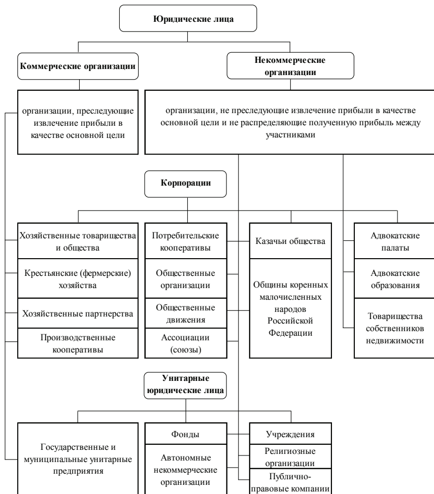
Рис. 1.2. Классификация юридических лиц в зависимости от основной цели и организационно-правовой формы [2]