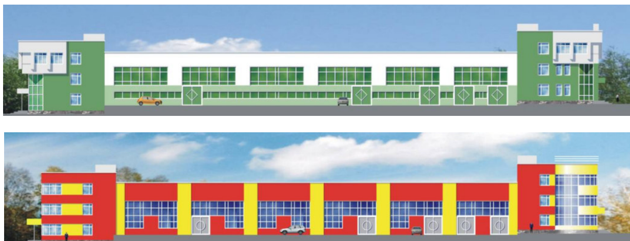
Рис. 2. Пример цветового решения промышленного объекта

Композиционные решения производственных зданий можно классифицировать в зависимости от способов размещения стоящего оборудования: здания с открытым фасадом; здания, обстроенные оборудованием; «здания-установки». Композиционные решения открытых установок, оборудования и сооружений более разнообразны, чем здания, как разнообразны и сами аппараты, объединяемые в группы (технологические установки и агрегаты). И хотя само объединение их обусловлено в первую очередь технологическими факторами, архитектор может активно влиять на решение композиционных задач.