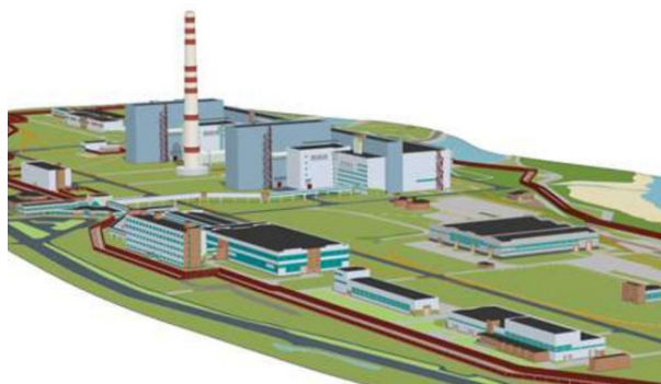
Рис. 1. Централизованное размещение коммуникаций промышленного объекта

Задачи исследования: совершенствование планировочной системы; методы повышения энергоэффективности производственного здания; принципы повышения значения функциональности в промышленной архитектуре; повышение архитектурно-художественных качеств