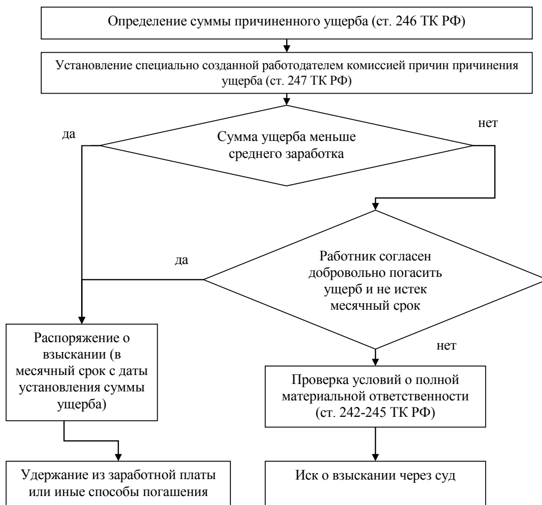
Рис. 2. Схема взыскания сумм ущерба с работника

■ неисполнения работодателем обязанности по обеспечению надлежащих условий для хранения имущества, вверенного работнику [4].