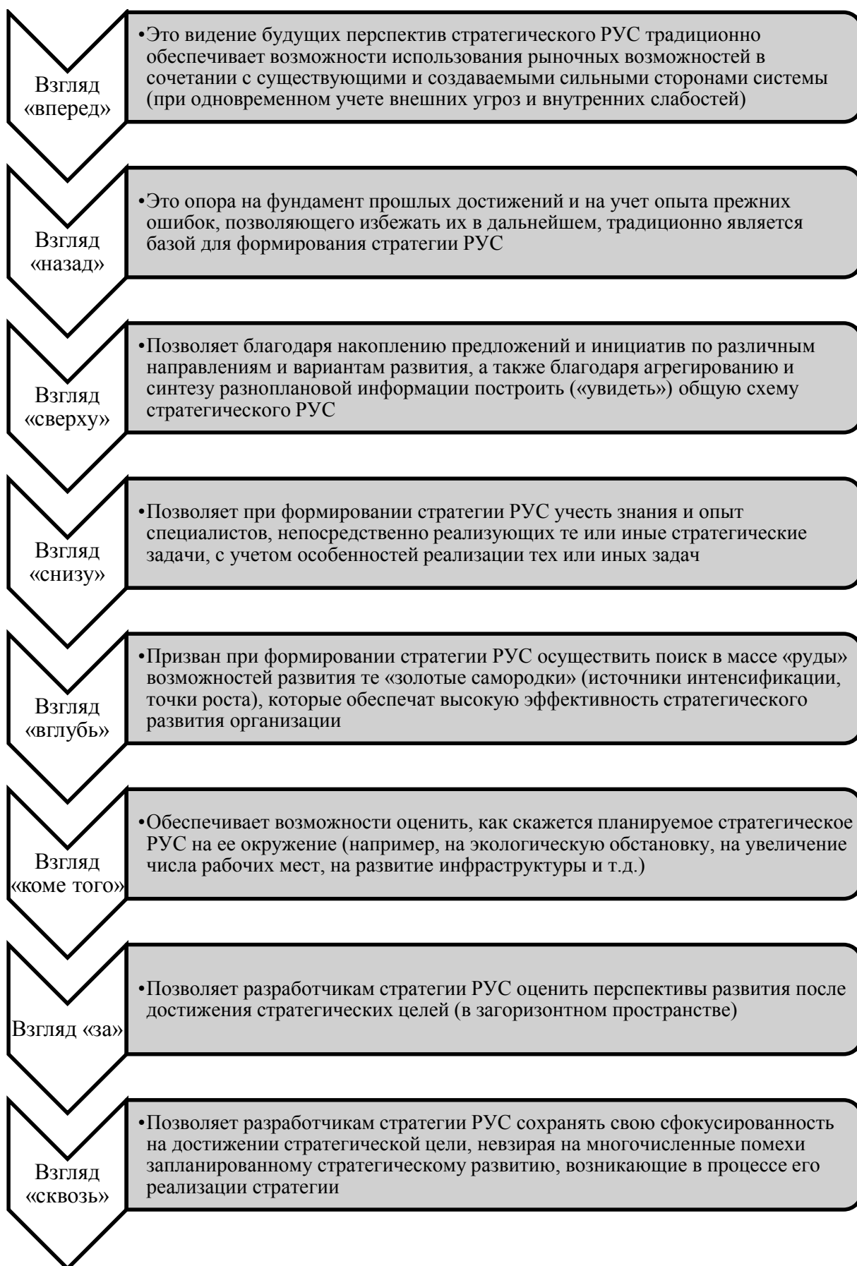
Рис. 3. Зрительная система школы предпринимательства Й. Шумпетера, используемая для анализа планов и процессов развития управляемой системы (РУС)