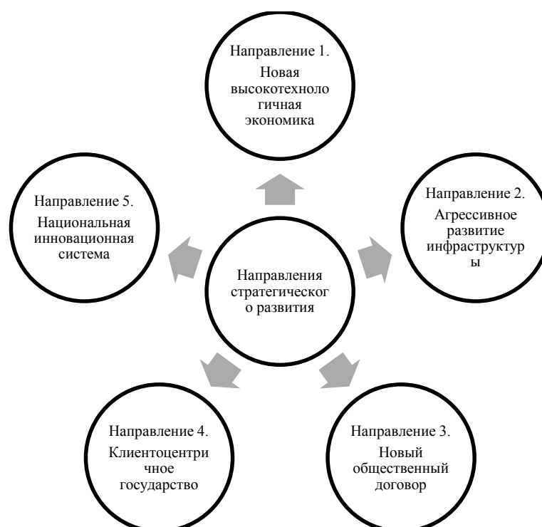
Рис. 2. Пять стратегических направлений развития, заложенных в формируемой Правительством РФ «Стратегии-2030»

Следующая важная ступень исследования заключается в том, что автор раскрывает содержание национальных целей, что создает возможность проводить анализ каждой конкретной цели, определить картину их развития, перспективы развития и, соответственно, прогноз их выполнения. При этом здесь отсутствуют фразеологизмы. Автор подробно исследует и опирается на информацию о содержании формируемой в настоящее время Правительством РФ «Стратегии социально-экономического развития РФ до 2030 года» [2], что само по себе требует пристального внимания и изучения. Говоря о перспективах достижения национальных целей, автор указывает пять стратегических направлений развития, заложенных в стратегии, формируемой Правительством РФ (рис. 2) [7].