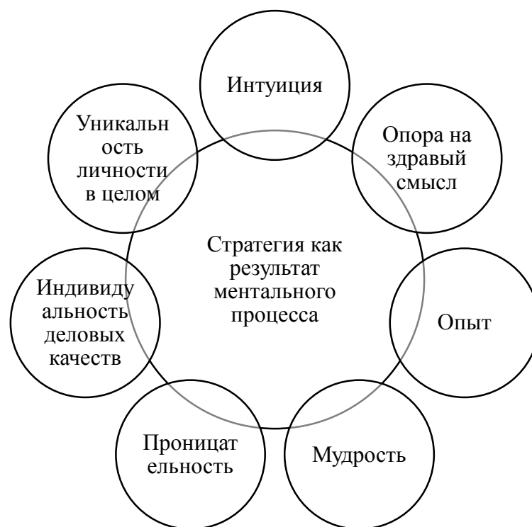
Рис. 3. Учет в рамках школы предпринимательства предпринимательских качеств, базового на научной основе школы дизайна, рассматривающей стратегию как результат ментального процесса

Проведенные исследования роли предпринимателя как основной движущей силы в механизме развития бизнеса позволили выявить обязательные и необязательные составляющие роли предпринимателя в рассматриваемом механизме по Й. Шумпетеру [24] (рис. 4), которые сохранили свою высокую актуальность в современных условиях предпринимательства.