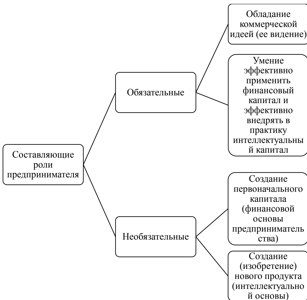
Рис. 4. Обязательные и необязательные составляющие роли предпринимателя как основной движущей силы в механизме развития бизнеса по Й. Шумпетеру

Рассматривая предпринимательские способности как фактор производства, безусловно, следует отметить вклад Й. Шумпетера [24] в оценку высокой значимости предпринимательских способностей в развитие бизнеса, обусловленный тем, что: