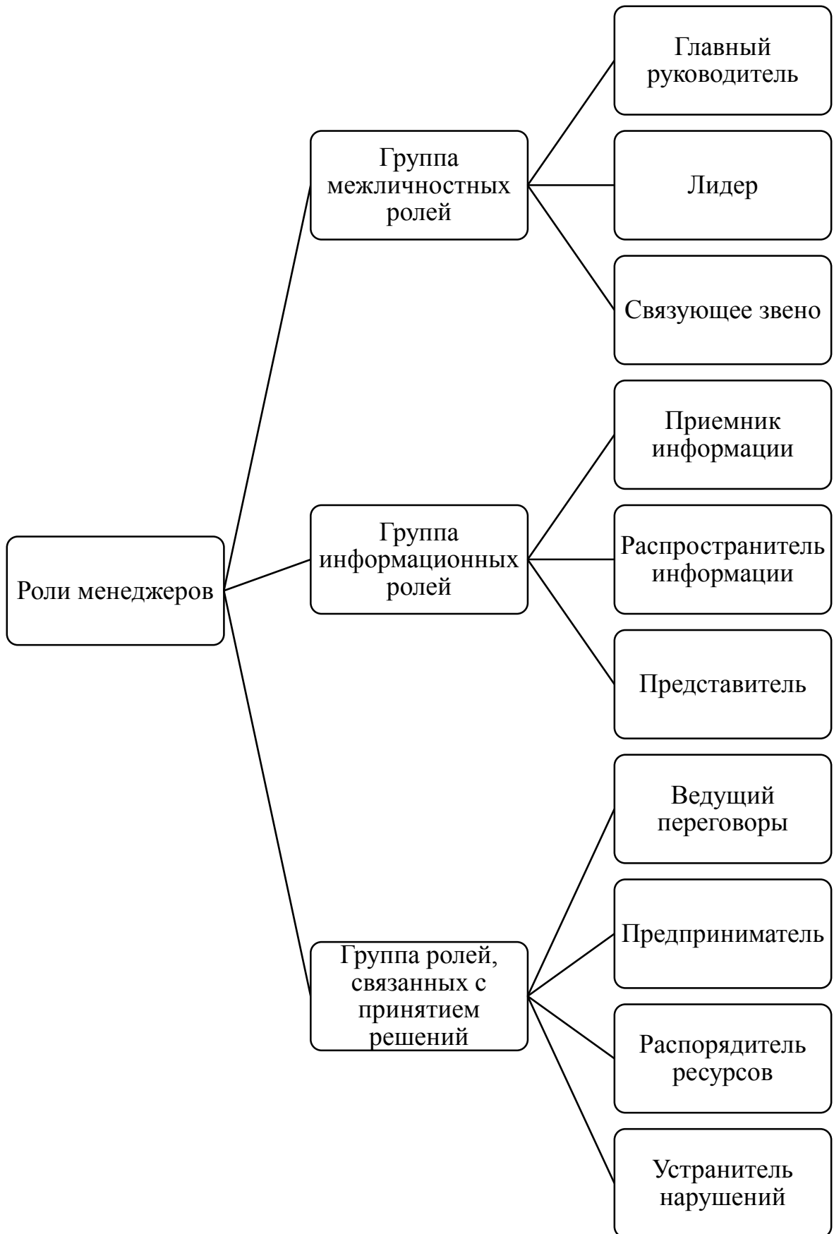
Рис. 5. Классификация ролей менеджеров по Г. Минцбергу [16]