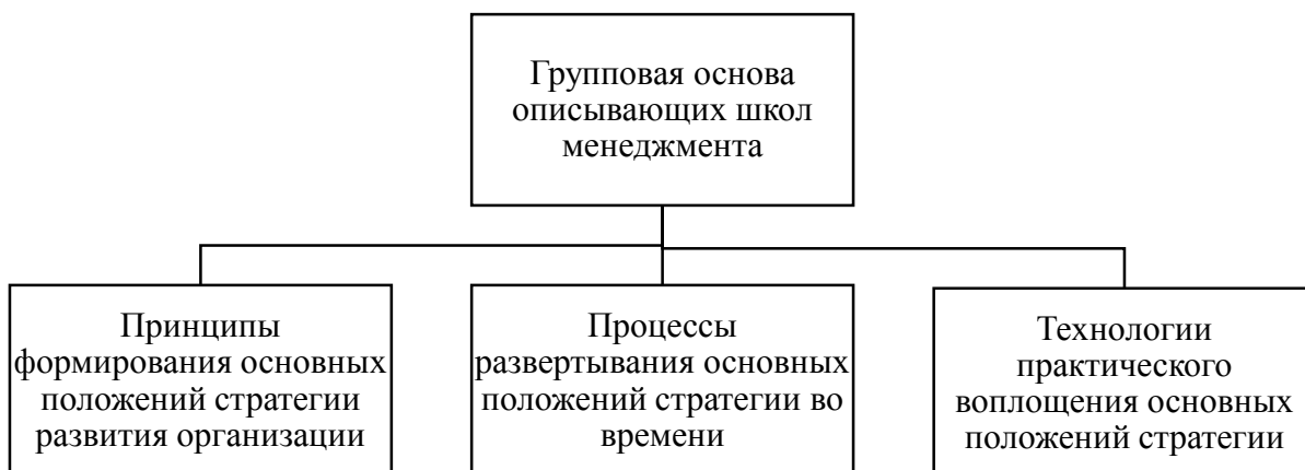
Рис. 2. Взаимосвязанные подходы, составляющие групповую основу описывающих школ менеджмента

При этом анализ экономических предпосылок построения стратегии в рамках школы предпринимательства показал, что, соглашаясь с распространённым мнением [15] об общности экономических корней школы позиционирования и школы предпринимательства [13] (при том, что последняя была дополнена теорией созидательного разрушения Й. Шумпетера [24]), в то же время нельзя согласиться с не менее распространённым мнением о том, что положения школы предпринимательства являются полным антиподом положений школы дизайна [15], поскольку, по мнению авторов, трудно представить себе функциональное развитие положений школы предпринимательства без базового рассмотрения стратегии как результата ментального процесса, протекающего в сознании менеджера-лидера (как главного «архитектора» стратегии развития бизнеса), лежащего в основе школы дизайна [13] (рис. 3).