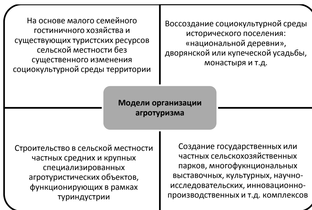
Рис. 2 – Модели организации агротуризма

Для размещения гостей в эко-парке имеются Гостиница-теплица, Дом-Ковчег, сочетающий в себе ферму и хостел, гостевые дома необычной архитектуры и различной вместимости, функционируют баня, ресторан, павильон творческих мастерских, контактный Лама-парк (ламы, лошади, ослики, козы, верблюды и пони). Конная эко-школа и Лама-парк развивают направления иппо- и лама-терапии, пока мало известные в России.