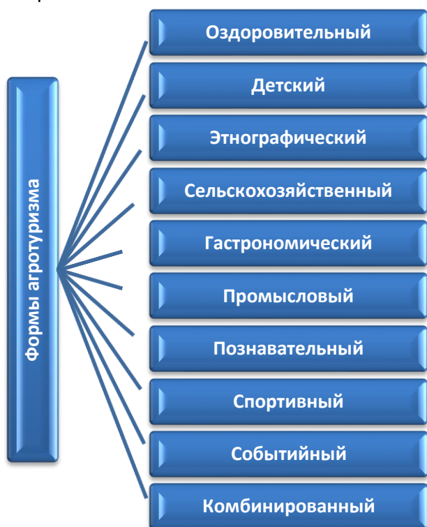
Рис. 1 – Формы агротуризма Тульской области

дуктов пчеловодства и т.д. Данный вид туризма в Тульской области весьма распространён. В частности, усадьба «Варваровка», расположенная в одноименной деревне вблизи музейного комплекса «Ясная Поляна», предлагает своим гостям баню на дровах с дубовыми вениками, сауну с бассейном, уединение с природой вдали от городской суеты на свежем воздухе в незабываемом деревенском колорите 2 .