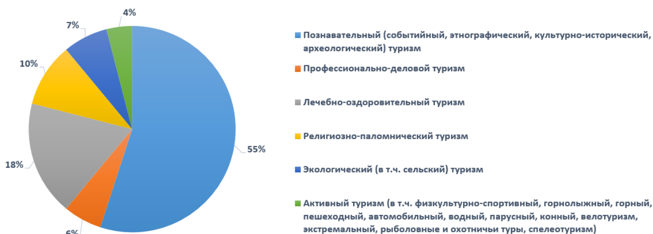
Рис. 4 – Объем туристического потока в Тульской области

личество индивидуальных бронирований. Не дают всей полноты картины о возможных вариантах сельского отдыха Туристический портал Тульской области и Национальный туристический портал, из-за чего страдает информированность потенциальных туристов. Однако следует заметить, что слабое информационное сопровождение – это достаточно серьёзная, но вполне устранимая проблема.