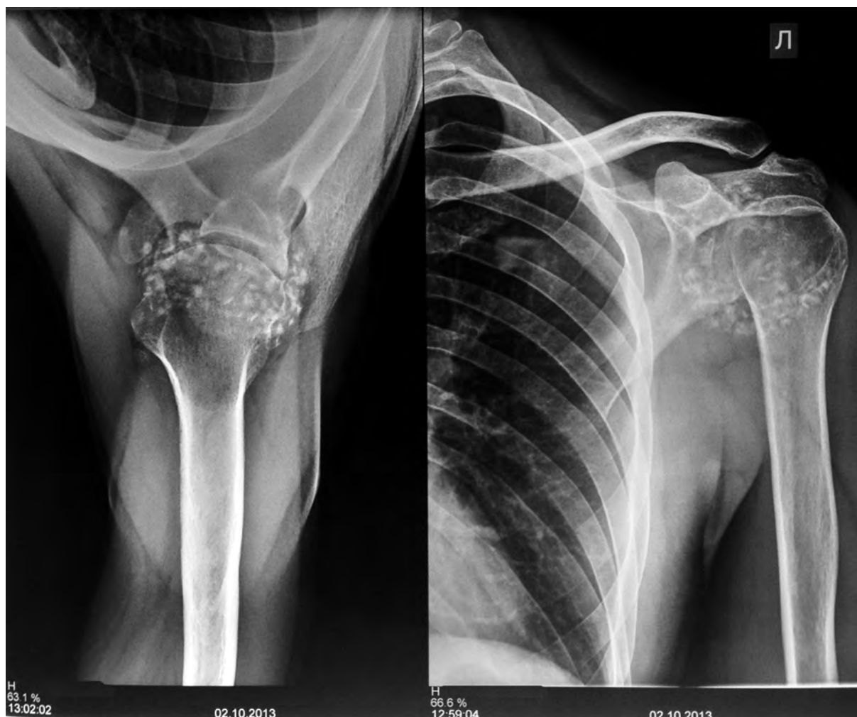
Рис. 1. Рентгенограммы пациента X, в прямой и аксиальной проекции (до операции).

Данное состояние пациента беспокоило на протяжении более 4 лет. Со слов пациента, травма исключена, боли в левом плечевом суставе появились на фоне полного здоровья и прогрессировали со временем. За медицинской помощью обратился в поликлинику по месту жительства, назначен курс консервативного лечения (мази НПВП местно, покой) с минимальным положительным эффектом. При обращении пациента в поликлинику ИНЦХТ в октябре 2013 г. выполнено рентгенографическое исследование (рис. 1) левого плечевого сустава в двух стандартных проекциях. На рентгенограмме левого плечевого сустава обнаружены множественные хондромные тела размерами от 0,2 × 0,5 × 1,0 см до 0,8 × 0,8 × 1,0 см. Дополнительно выполнена МРТ левого плечевого сустава (рис. 2). Заключение МРТ от 28.05.2013 г.: наличие свободных внутрисуставных тел, заполняющих всё пространство полости плечевого сустава.