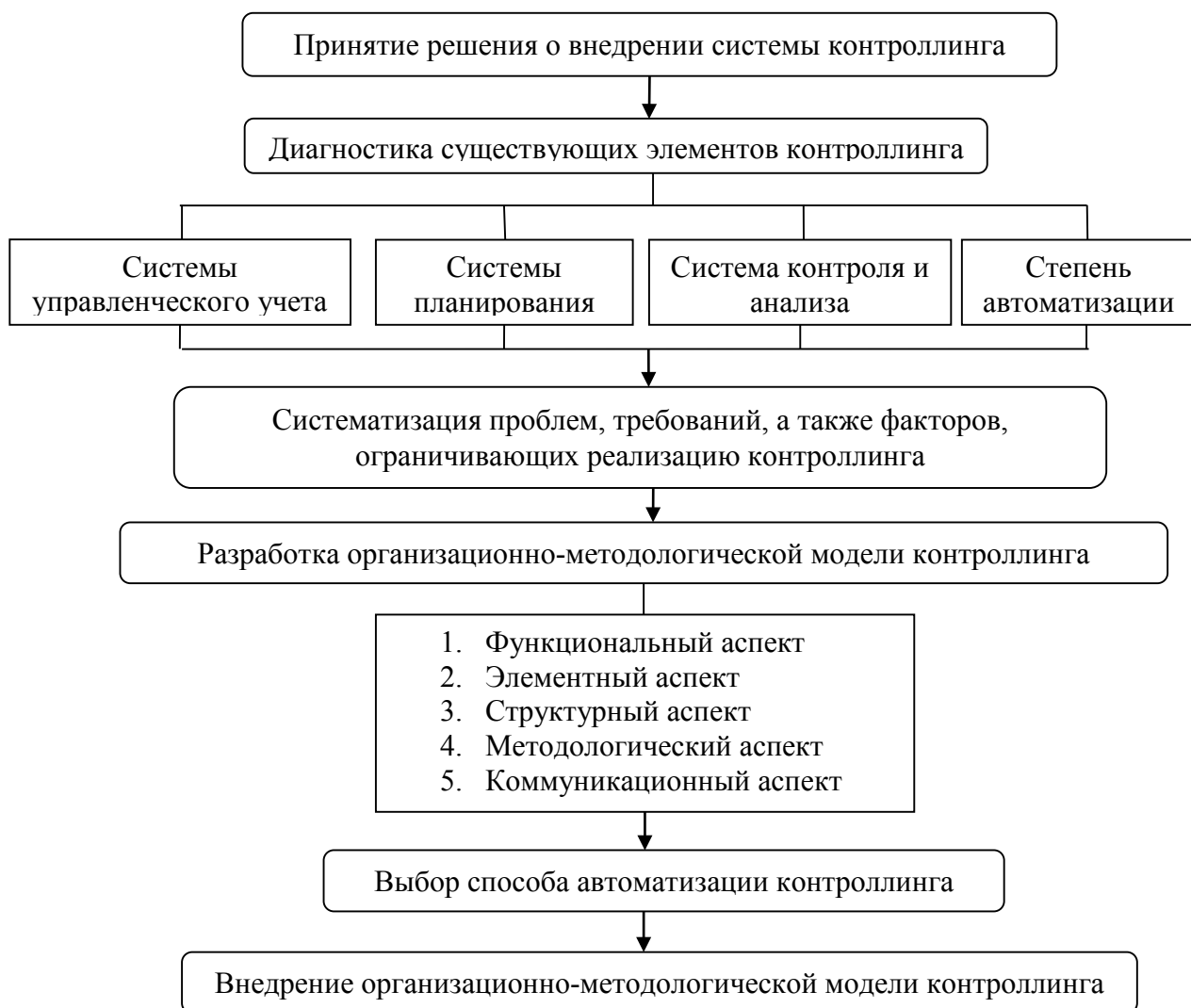
Рис. 1. Дорожная карта внедрения контроллинга в организации сферы культуры