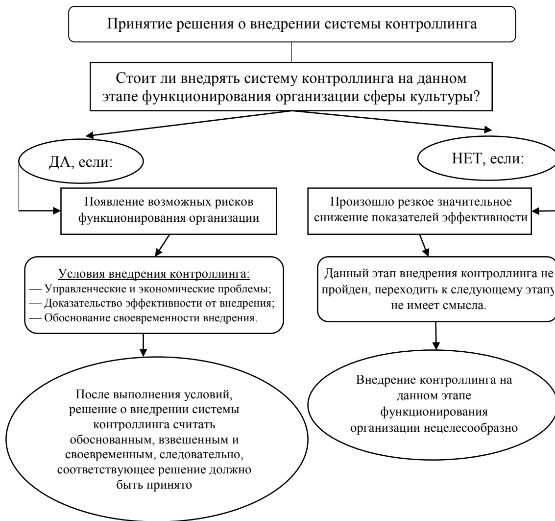
Рис. 2. Первый этап дорожной карты «Принятие решения о внедрении системы контроллинга»