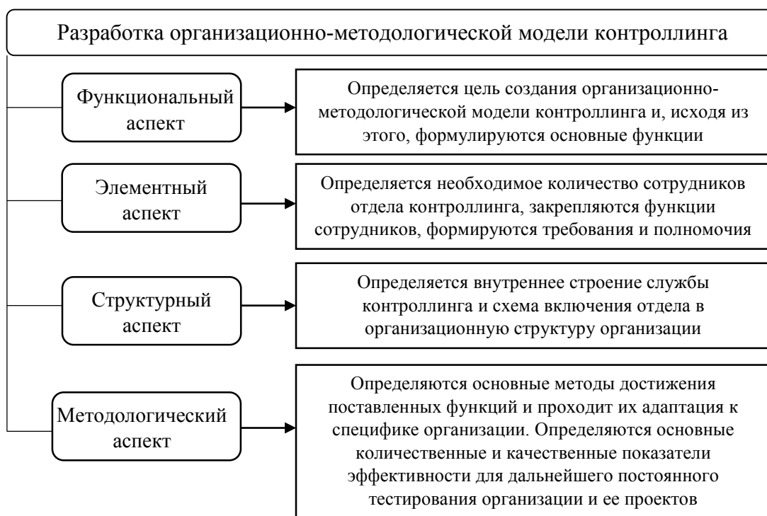
Рис. 4. Третий этап внедрения контроллинга «Разработка организационно-методологической модели контроллинга»

На основе полученных результатов в ходе диагностики существующих в организациях сферы культуры элементов контроллинга необходимо выявить самые существенные возникающие проблемы и установить определенные требования к внедрению системы контроллинга. Исходя из этого, следующим этапом дорожной карты внедрения системы контроллинга в организации культуры следует назвать – разработку организационно-методологической модели контроллинга, формирование которой включает ряд аспектов, что наглядно представлено на рис. 4.