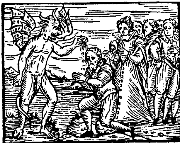
Рис. 2. Дьявол помечает своего приверженца на шабаше (R.P. Guaccius, 1626 г.)

Церемония подписания договора с дьяволом, которая происходила на шабаше, в большинстве случаев проходила в удаленном месте, где проводились различные богохульства, в том числе переворачивание креста, топтание его ногами и т.д. Договор записывался справа налево, подписание договора осуществлялось левой рукой (рис. 2).