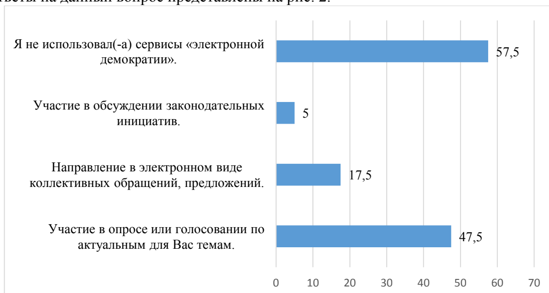
Рис. 2. Ответы респондентов на вопрос об использовании сервисов кибердемократии, %

Для выявления сервисов кибердемократии, обладающих наибольшей популярностью, был задан вопрос «Какие из перечисленных механизмов электронной демократии Вам приходилось использовать?». Респонденты могли выбрать несколько вариантов ответа. Ответы на данный вопрос представлены на рис. 2.