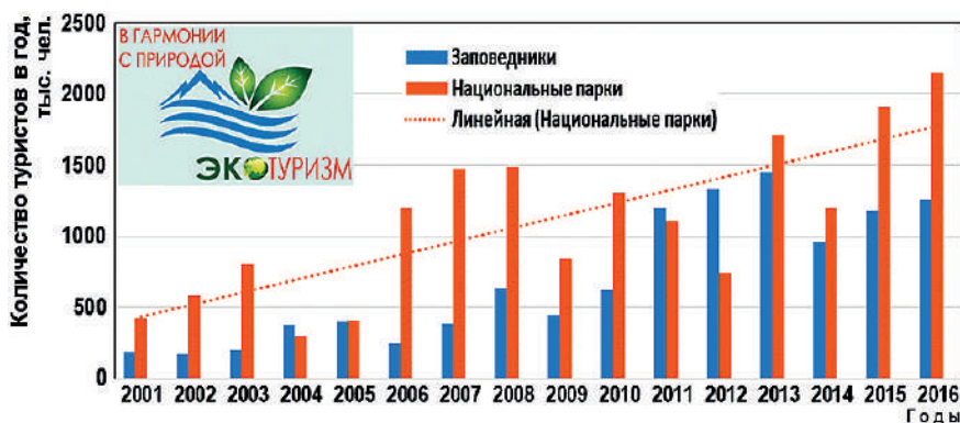
Рис. 4 – Динамика количества посетителей (экотуристов) в заповедниках и национальных парках России (по данным Росстата)

Ориентация на «североамериканский» вариант эколого-туристской деятельности и большая работа по формированию специальной инфраструктуры привели к заметному увеличению количества посетителей федеральных ООПТ и положительной динамике этого показателя (рис. 4). На рис. 4 заметен тренд на увеличение