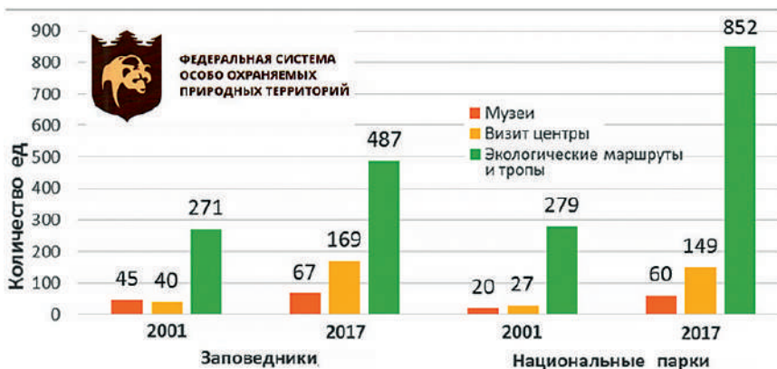
Рис. 3 – Количество объектов инфраструктуры для обслуживания посетителей в заповедниках и национальных парках России в 2001 и 2017 гг. (по данным Росстата 8 )

Для посетителей (экотуристов) в национальных парках и даже в заповедниках на разрешённых участках строят специальные инфраструктурные объекты – музеи и визит-центры. Около интересных природных, историко-культурных и этнографических объектов прокладывают туристские маршруты или оборудуют экологические тропы. В удобных местах, если это разрешено зонированием территории ООПТ, возводят