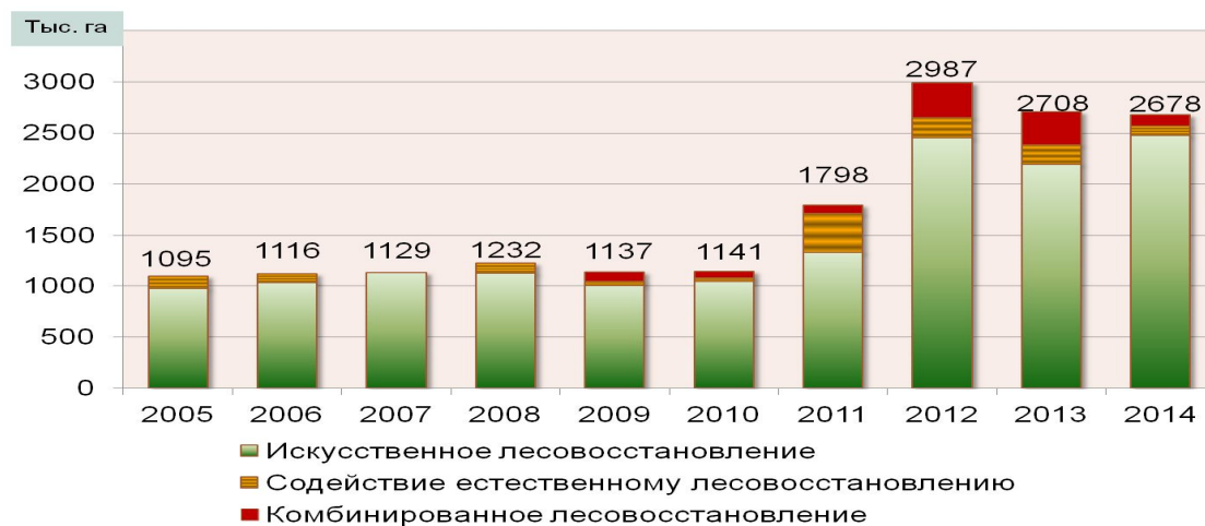
Рис. 2. Динамика лесовосстановления в Воронежской области