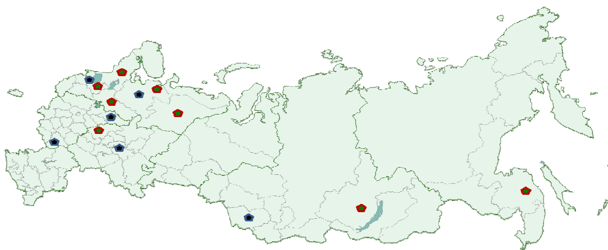
Рис. 3. Локация лесосеменных центров и тепличных комплексов

градская области) составили 1,78 млрд р., т. е. стоимость строительства и ввода в эксплуатацию одного ЛССЦ составила в среднем 296 млн р.