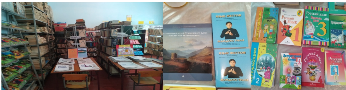
Рис. 2. Библиотека школы-интерната для глухих детей: бумажные носители

Выделим компоненты образовательной среды УМЛ: бумажные носители, цифровые носители, технические и электронные ресурсы (рис. 2, 3):