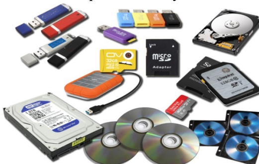
Рис. 3. Библиотека школы-интерната для глухих детей: цифровые носители

Обеспечение школ-интернатов видами УМЛ позволяют лучшему пониманию и осознанию содержания книги. Например, для учителей по предмету «Кыргызский язык» применяются в качестве методического пособия [12], в котором раскрываются этнопедагогические идеи Кыргызского национального фольклора, вопросы народного воспитания, виды, методы, принципы воспитания, способы их применения в учебно-воспитательной работе [13], определяющие речевую деятельность, виды, типы письменных работ, технологии обучения письму, нормативы, образцы и др. В книге изложены сущность, словосочетание, его использование, дальнейшая речевая и письменная деятельность ученика, дидактические требования к нему, его научная характеристика, теоретические и практические вопросы речевой, письменной деятельности, в том числе к сочинению, изложению, письму. С внедрением информационных компьютерных технологий, классно-урочную систему, являющуюся основной формой обучения, можно сделать более эффективной, интересной и практичной. К примеру, линия УМК «English 5-9» [14], созданная с учетом требований ГОС, предоставляет широкие возможности для создания инновационной образовательной