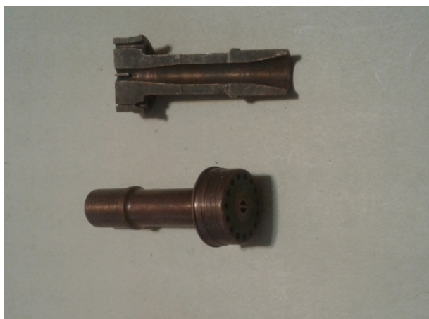
Рис. 3. Разрез (вверху) и общий вид (внизу) форсунки с центральным каналом, имеющим геометрию сопла Лавалья

Анализ вариантов технологических процессов, используемых при изготовлении каналов в форсунках, применяемых для подачи горючих жидкостей, в том числе жидкого водорода, по критерию полезности послужил основанием для обоснования эффективности выбора наиболее технологичного комбинированного эрозионно-химического способа прошивки центрального отверстия (см. рис. 3) с профилем проточной части в форме сопла Лавалья [5]. Этот вариант оказался наиболее производительным и позволил повысить ресурс