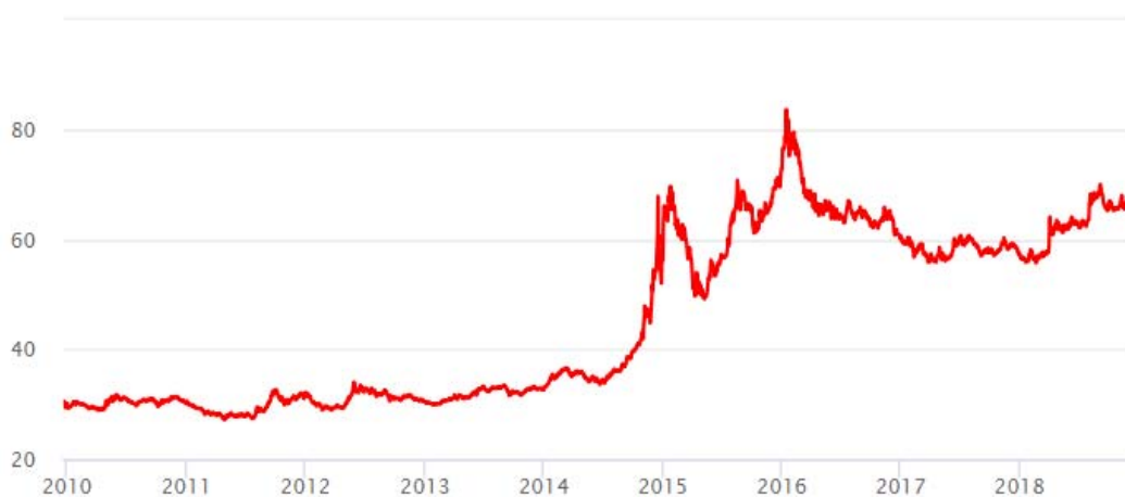
Рис. 2. Динамика курса доллара США к рублю с 2010 по 2018 г.*

В связи с тем, что продукция идет на экспорт, это позволяет получить больше дохода при реализации продукции на внешних рынках. Так же период 2014 – 2018 гг. характеризовался ростом цен на импортную продукцию на внутреннем, в результате чего активно начало развиваться импортозамещение. При этом отечественная продукция также увеличивалась в цене во избежание дефицита.