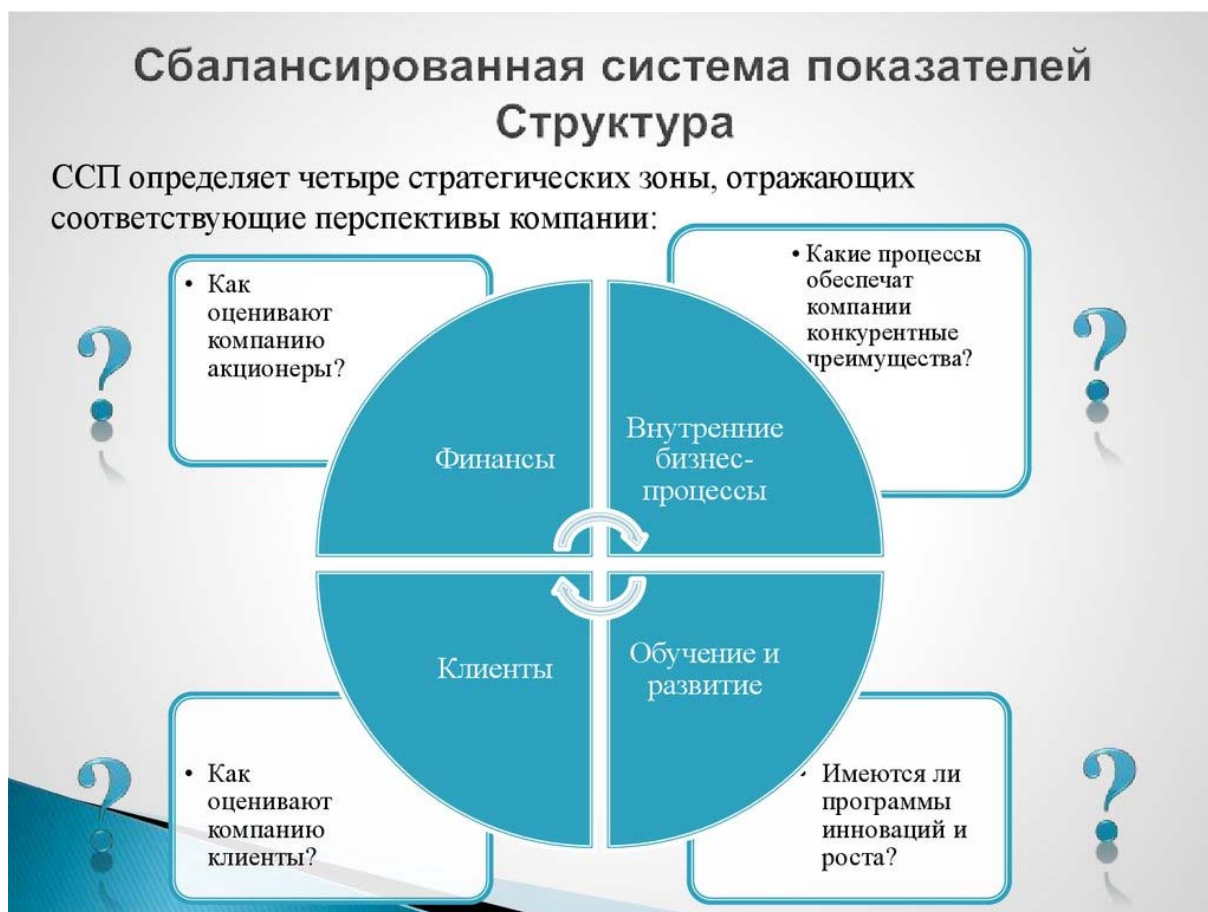
Рис. 2. Схематичное представление системы сбалансированных показателей Д. Нортон и Р. Каплана

Схематически система сбалансированных показателей Д. Нортон и Р. Каплана представлена на рис. 2.