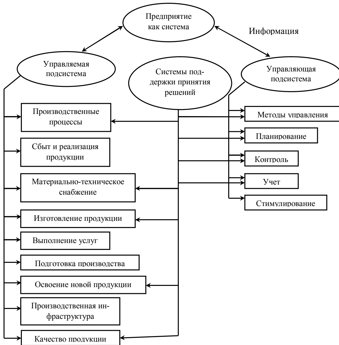
Рис. 1. Системная модель управления

В ряд задач, поставленный перед информационной системой управления ставятся такие задачи как стратегическое и оперативное планирование, бухгалтерский учет. В процессе функционирования автоматизированной информационной системы получаемая за счет этого процесса информация предоставляет руководителю предприятия ряд инструментов, решающих задачи различных сфер. Оценка результатов управленческих решений или налаживание оперативного управления себестоимости продукции, элементарная распланировка или сбалансирование ресурсов – лишь типичные примеры решаемых задач. На предприятии системный подход к управлению ресурсами и информационными потоками можно представить следующим образом (рис. 2).