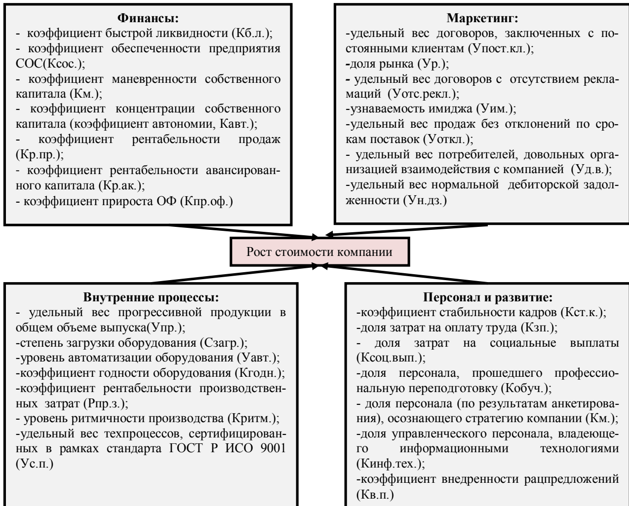
Рис. 4. Комплексная система сбалансированных нормируемых показателей эффективности стратегического управления

Разработанная согласно изложенной методике система сбалансированных нормированных показателей приобретает вид, представленный на рис.4.