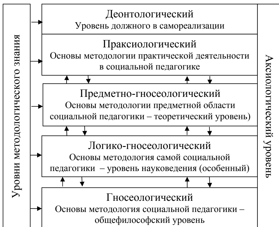
Рис. 2. Модель, отражающая структуру (уровни) методологии социальной педагогики

Характеризуя представленную авторскую модель концепции методологии социальной педагогики, Л.В. Мардахаев отмечает, что базовым компонентом методологии социальной педагогики выступают ее методологические основы – гносеологические основы. Именно гносеологические основы, по мнению ученого, представляют важнейший компонент методологии социальной педагогики. Они определяют общенаучные знания других наук (методологические основы в широком смысле) – основные положения наук (педагогике, социологии, общей и социальной психологии, антропологии, социального права, социального управления, социальной информатики, социальной работы, валеологии, экологии, медицины и др.) об обществе и человеке, определяющие методологические ориентиры и основные направления, содержание, организацию и методику познания и преобразования социально-педагогической практики в соответствии со спецификой объектно-предметной сферы [10].