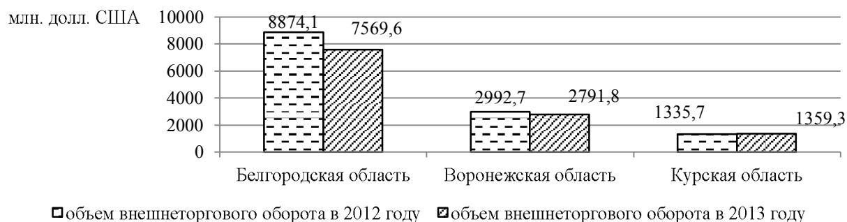
Рис. 1. Динамика объема внешнеторгового оборота Белгородской, Воронежской и Курской областей в 2012–2013 гг.*

Данные рисунка 1 наглядно свидетельствуют о том, что наибольший объем внешнеторгового оборота наблюдается в Белгородской области, однако в исследуемом периоде данный показатель снижался. Объем внешнеторгового оборота Курской области напротив увеличивается, однако величина данного показателя значительно меньше, чем в других изучаемых регионах.