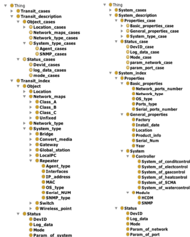
Рис. 1. Модель онтологии аппаратного и транзитного уровня применяемой в АСДУ

В результате исследований была спроектирована и реализована межуровневая концепция хранения знаний о системе в структурированном виде. Выделенные уровни функционирования системы представляют собой наиболее законченный набор однородных объектов, что позволяет обеспечивать модернизацию АСДУ на каждом уровне за счет расширения элементной базы. На каждом из трех уровней (рис. 1) была разработана модель онтологии, включающая в себя унифицированное описание элементов подсистем.