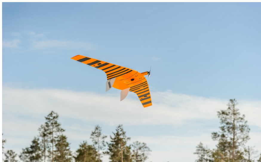
Рис. 2. Беспилотный летательный аппарат Supercam S350