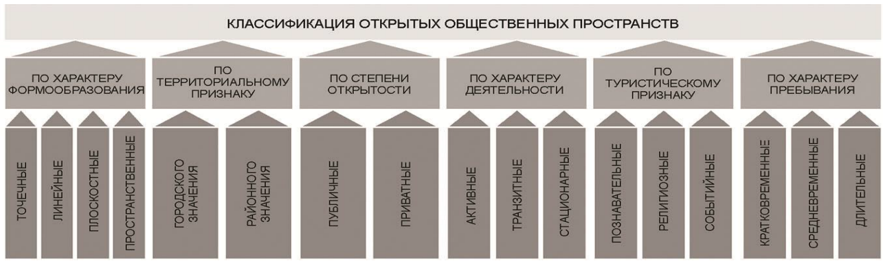
Рис. 1. Классификационные характеристики открытых общественных пространств. Сост. Заикина A.C.

тия), от способа передвижения и т.д. Пространство города характеризуется сложной комбинацией типов городской среды и социумов с различными средовыми ориентациями [9]. Общественные рекреационные пространства вдоль градостроительной композиционной оси — малой реки в границах города всегда имеют большое значение для качества среды жизнедеятельности [10].