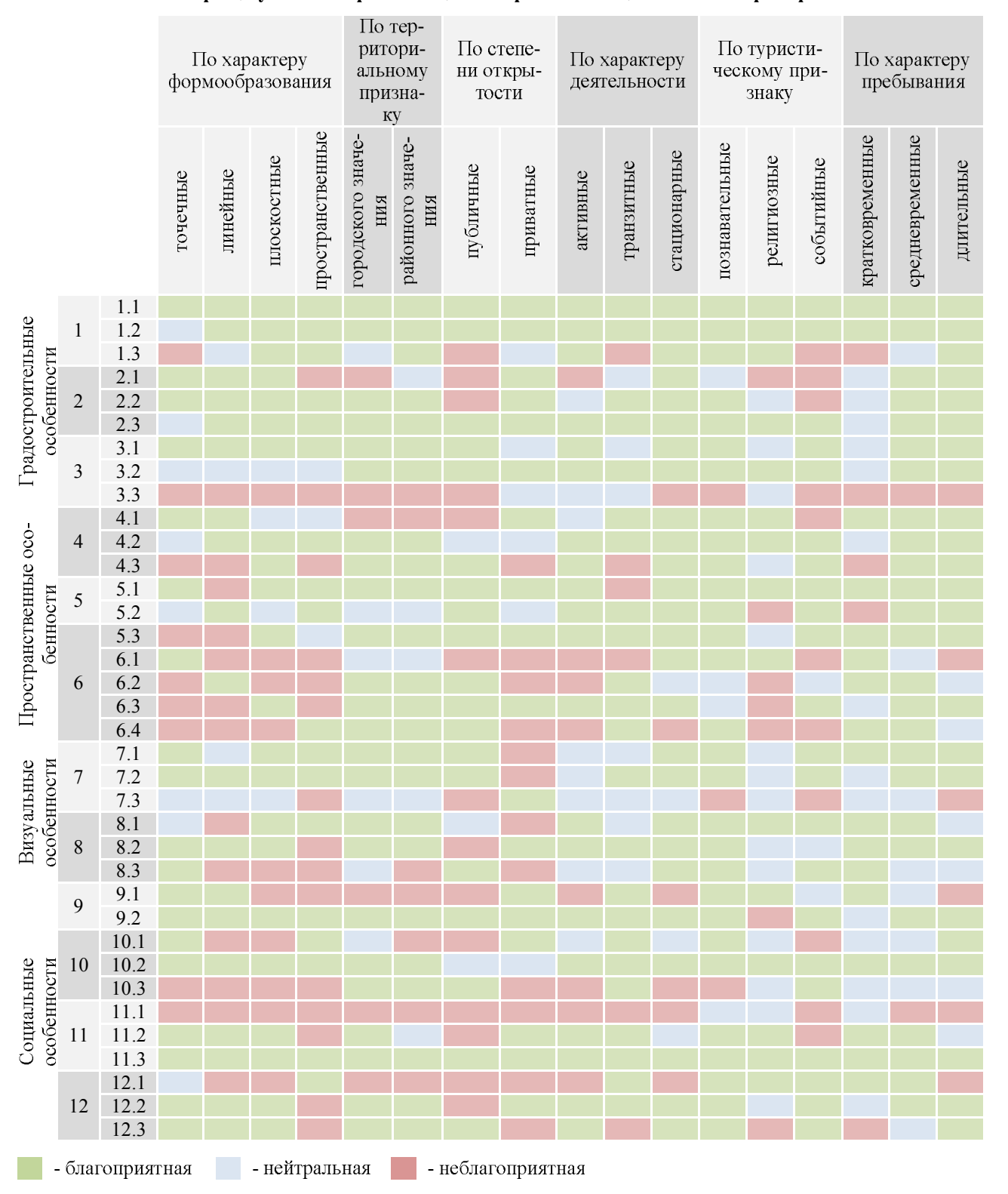
Таблица 1 Матрица условий организации открытых общественных пространств