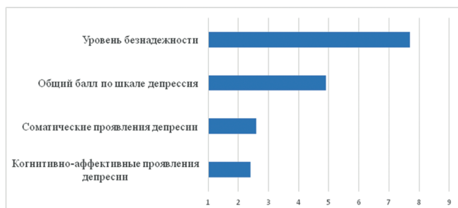
Рис. 3. Результаты изучения симптомов/проявления депрессии и уровня безнадежности у участников СВО, потерявших зрение в результате боевой травмы ( n = 60 )

Следующий шаг настоящего исследования заключался в изучении симптомов/проявления депрессии и уровня безнадежности у участников СВО (рис. 3). Общий балл по шкале депрессии составил 4,9, что свидетельствует об отсутствии симптомов депрессии или их минимальном проявлении в группе респондентов. Вместе с тем необходимо отметить, что у шести военнослужащих обнаружена легкая степень депрессии, у шести человек — выраженная депрессия.