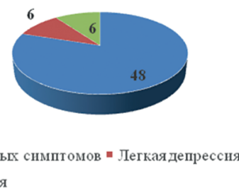
Рис. 4. Степень выраженности депрессии у участников СВО, потерявших зрение в результате боевой травмы ( n = 60 )

выраженной депрессией характерны постоянное ощущение эмоциональной тяжести и подавленности, фоновая грусть, переходящая в слезы и снижающая настроение, чувство пустоты и безрадостности, снижение мотивации и повышенная утомляемость.