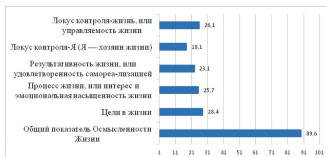
Рис. 1. Результаты изучения смысложизненных ориентаций у участников СВО, потерявших зрение в результате боевой травмы ( n = 60 )

статистика. Результаты изучения смысложизненных ориентаций представлены на рис. 1.