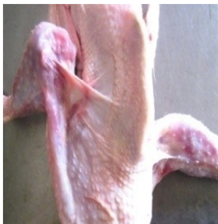
Рис. 2. Вывих тазобедренных суставов тушки при вынужденном забое кур-несушек в санитарной бойне после отделения пера в барабане