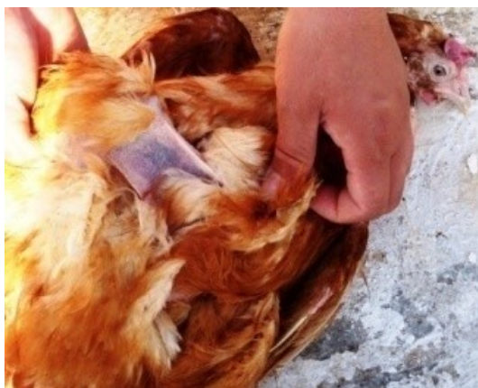
Рис. 1. Перелом тазобедренной кости у кур-несушек при остеопорозе

Результаты исследований. В результате клинического осмотра птицепоголовья в опытной и контрольной группах было установлено выраженное нарушение фосфорно-кальциевого обмена, когда куры-несушки начинают «садиться на ноги» и происходит ослабление прочности костей скелета – остеопороз. Количество выбракованных кур-несушек по причине вынужденного убоя ежедневно составляло 65-70 голов. У птиц в отличие от других животных высокая степень интенсивности минерального обмена, в том числе и фосфорно-кальциевого. Топография проявления нарушения фосфорно-кальциевого обмена начиналась с того, что куры-несушки начинают «садиться на ноги», не могут передвигаться в клетке, поесть корм и пить воду. Это продолжается в течение 3-4 дней. Они выбраковываются и при извлечении больных кур-несушек из клетки у подавляющего большинства происходит перелом трубчатых костей задних ног и крыла (рис. 1).