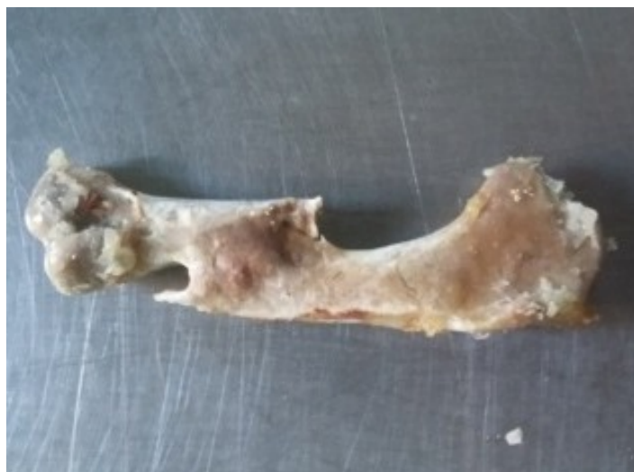
Рис. 4. Сращение переломленных трубчатых костей в организме кур-несушек в результате использования ЛиквиФос Стронг