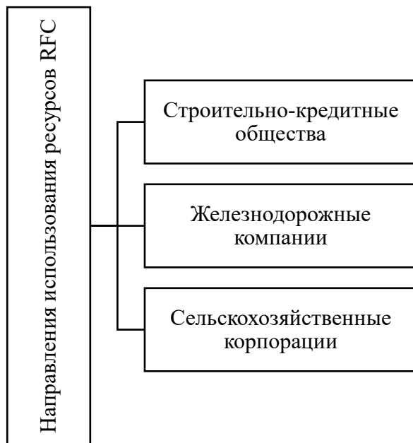
Рис. 2. Направления использования ресурсов RFC в качестве предоставляемых «чрезвычайных» кредитов банкам

Направления использования ресурсов RFC в качестве предоставляемых «чрезвычайных» кредитов банкам представлены на рис. 2.