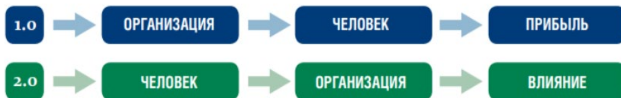
Рис.2. Цепочка звеньев в моделях менеджмента М1.0 и М2.0 в интерпретации Хэмела Г. [2]

Авторы представили результаты сравнения моделей менеджмента М1.0 и М2.0, варианты которых в интерпретации Хэмела Г. представлено на рис.2 [2].