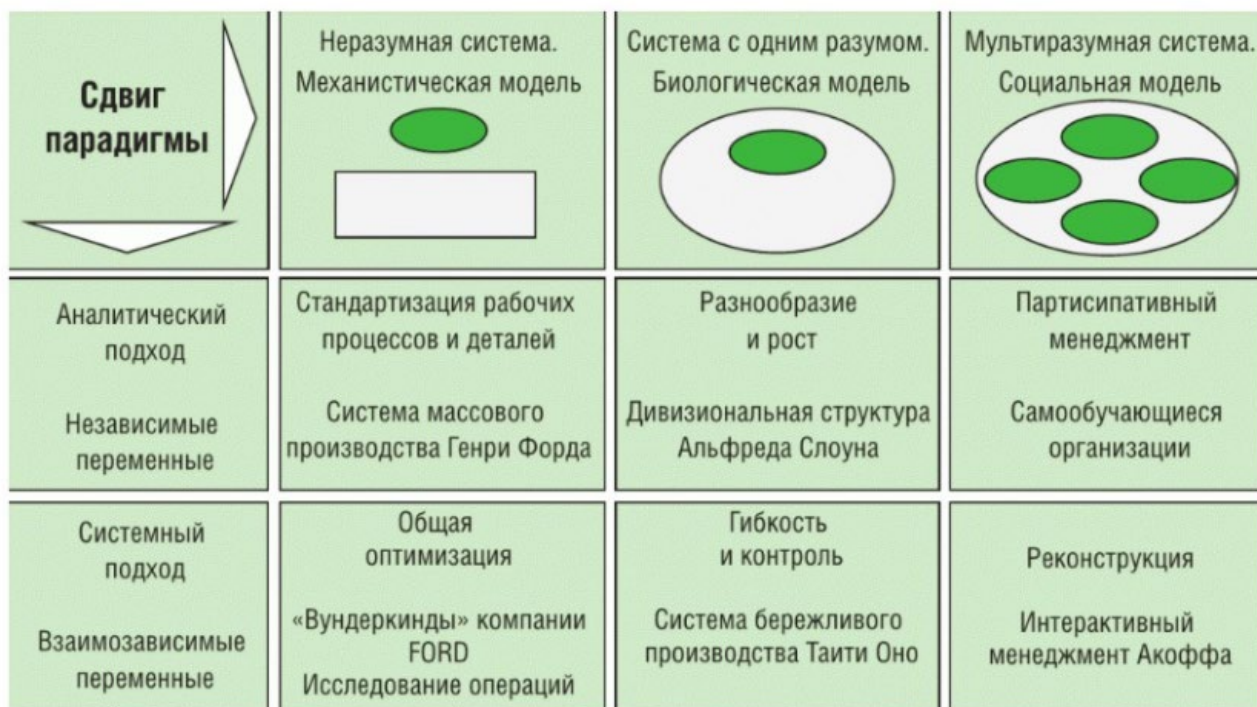
Рис.4. Сравнительная характеристика моделей менеджмента М1.0, М2.0 и М3.0, используемая для демонстрации смещения используемой в них парадигмы [10].

В частности, авторы указывают, «что и сегодня в менеджменте постиндустриальной экономики, в соответствии с принципом кумулятивного эффекта в менеджменте как науке, не отпала необходимость в реализации большинства положений, присущих моделям М1.0, М2.0 и М3.0 (рис.4) [10], начиная от поиска «вундеркиндов» (танталов), как у Генри Форда в модели М1.0 (рис.1), и заканчивая интерактивным планированием Рассела Акоффа [4] в модели М3.0 (рис.4) [10], базирующемся опять же на исследовании операций, присущем модели М1.0».