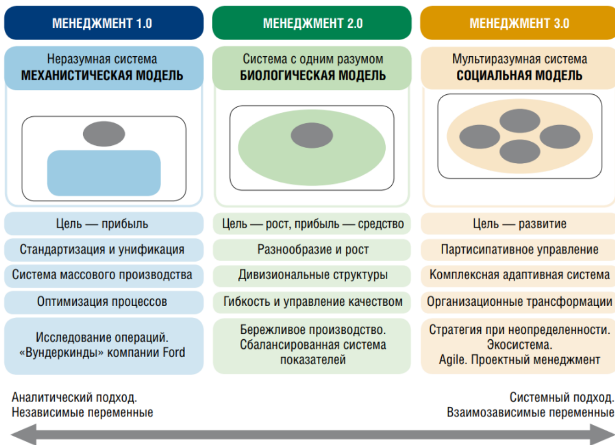
Рис.1. Принятое в настоящее время описание поколений моделей менеджмента М1.0, М2.0 и М3.0 [11].

Интересно и подробно раскрывают авторы основные черты модели менеджмента М1.0. Отметим лишь некоторые из них: четкая структура управления, фиксация управленческих процедур на бумаге и регламенты труда, четкая вертикаль управления, преобладание мировоззрения собственной культуры и др.