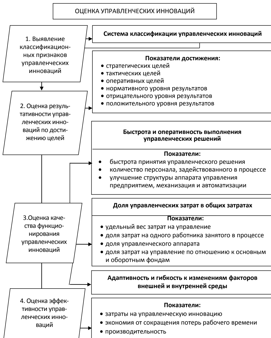
Рис. 2 – Оценка применимости управленческих инноваций

Основоположник инновационной теории Й. Шумпетер выделил следующие типы инноваций: технические, организационные, управленческие и маркетинговые инновации, новые рынки, финансовые нововведения и новые сочетания ресурсов и классифицировал нововведения как базисные и улучшающие