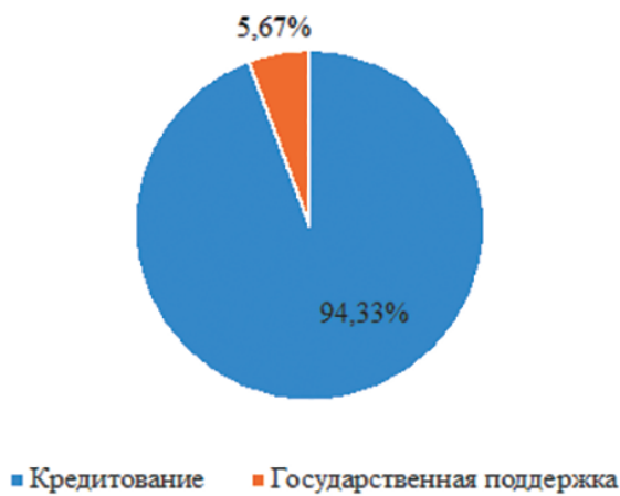
Рис. 3. Доли кредитования и государственной поддержки в финансировании малого бизнеса