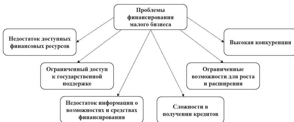
Рис. 2. Проблемы при финансировании малого бизнеса

При сохранении положительных темпов роста объемов кредитования субъектов малого бизнеса в этой сфере имеются определенные проблемы, как-то: частая необходимость залога, сложность в одоб-