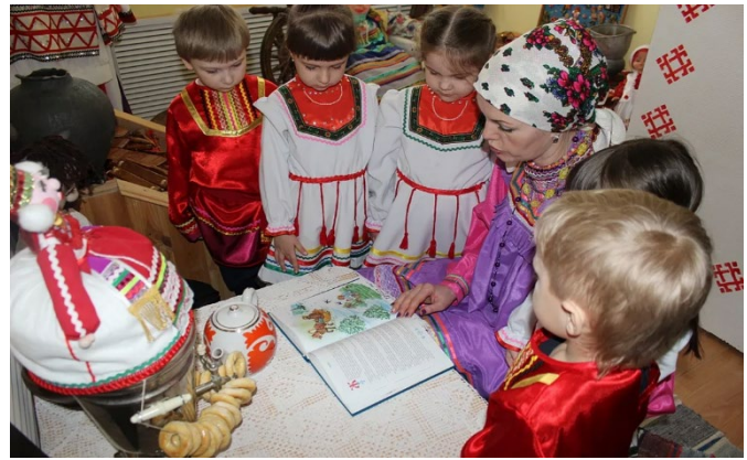
Рис. 2. Воспитание создателей и ценителей народного искусства

Традиционную художественную культуру создают мастера и среда. «А среда – не только природное окружение. Среда – это и отношения людей, тот человечески-нравственный климат, в котором живут национальные ценности. Не теряет смысл традиция. Другими словами, традиционная художественная культура в ее ДУХОВНОМ ЗНАЧЕНИИ, и эту задачу невозможно решить без системы образования и семьи. Сохранение культурного наследия невозможно без нового поколения создателей высокохудожественных изделий традиционного прикладного искусства, позволяющих принять все лучшее от предыдущих поколений и сделать традиции и технологии (в том числе ручного труда) востребованными в современных условиях. В народном искусстве всегда были династии, есть они и сегодня. Внуки и правнуки известных мастеров продолжают поддерживать высочайший уровень профессионализма и создают новые произведения традиционного прикладного искусства» [9].