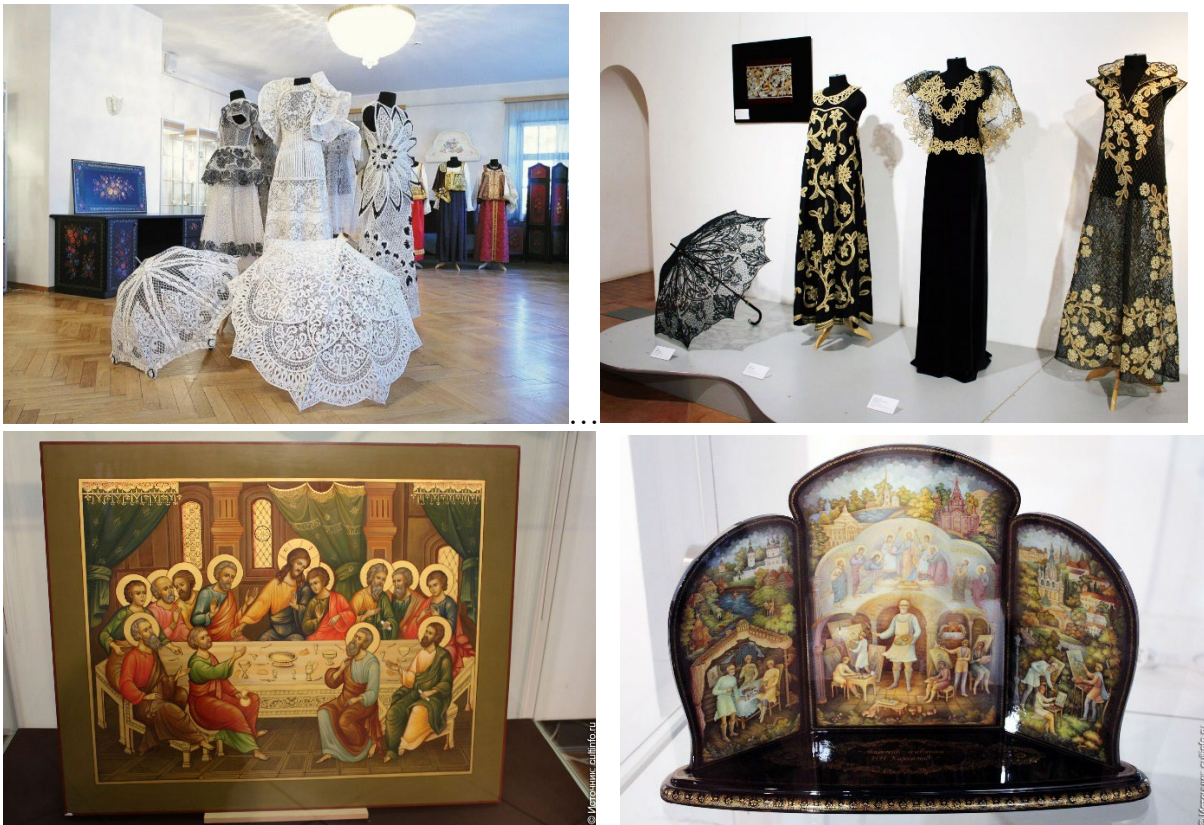
Рис. 3. Выставка работ студентов Высшей школы народных искусств (академии)

Ремесло – это понятие вошло устойчиво в обиход с революцией, когда народное искусство истреблялось как враждебное "советскому обществу", когда образ исключался из понятия "искусство народа", ведь он есть обязательная составная искусства. Беда в том, что именно примитивные народные промыслы (свистульки, игрушки, лозоплетение и т.п.) продолжают представлять как народное в образовании. Это очень пагубно и несёт большие нежелательные последствия, а ведь в учебных программах и школьных учебниках это проходит красной нитью.