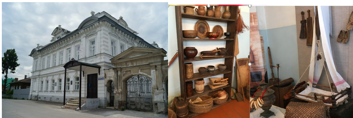
Рис. 1. Дом богатого купца в Балахне

К сожалению, сегодня в российском обществе преобладает второе понимание народной культуры – как крестьянской. На рис. 1 мы видим двухэтажный кирпичный дом купца и то, что экскурсовод демонстрирует посетителям внутри здания!