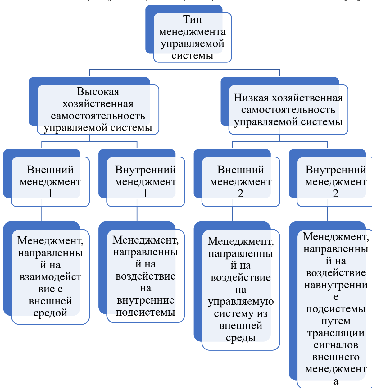
Рис. 6. Классификация типов менеджмента по признаку уровня хозяйственной самостоятельности управляемых систем [39]

С другой стороны, представителей внешнего менеджмента (под управлением которого и проводились гайдаровские реформы, рис. 6) [39] вполне устраивало, что члены российского правительства реформ Е. Гайдара были готовы выполнить установки по достижению всех предписанных им извне целей. Кто корыстно, кто идейно и т.д. В этом смысле внешний менеджмент гораздо меньше интересовало каким образом представители внутреннего менеджмента будут осуществлять решения каких-то частных задач, которые (решения) В.С. Черномырдин назвал «бесшабашными» [57].