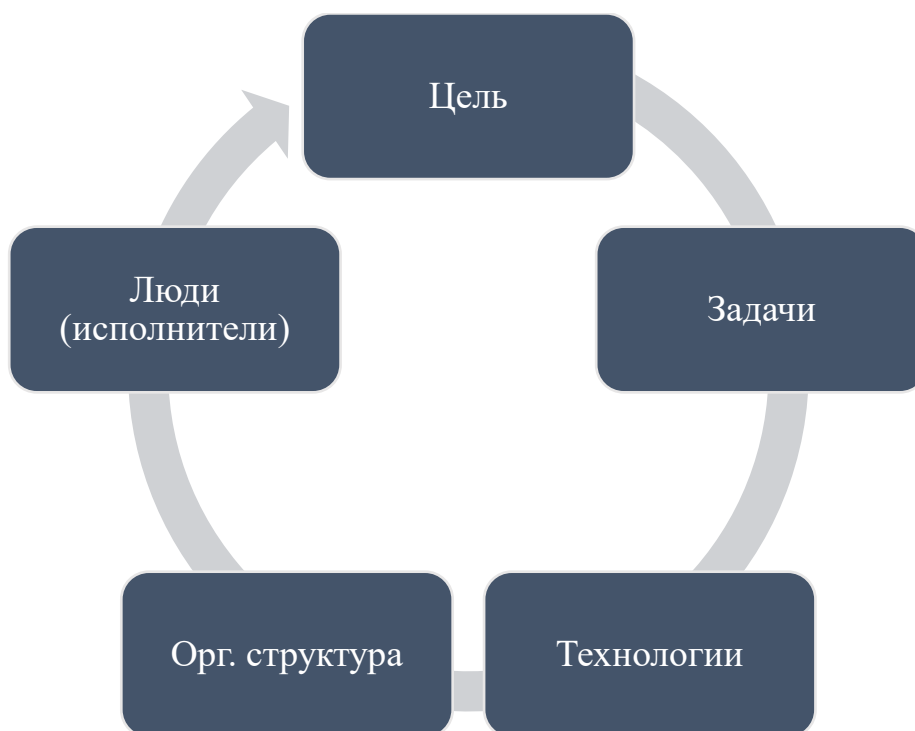
Рис. 1. Ключевые элементы системы менеджмента [39]

Учитывая, что в новейшей истории России наиболее масштабными и радикальными для экономики страны являлись гайдаровские реформы, с теоретико-методологических и научно-практических позиций представляет интерес рассмотрение опыта организации деятельности и формирования кадрового состава внутреннего топ-менеджмента при осуществлении гайдаровских реформ в интересах учета этого опыта для обеспечения эффективной трансформации национальной экономики на современном этапе.