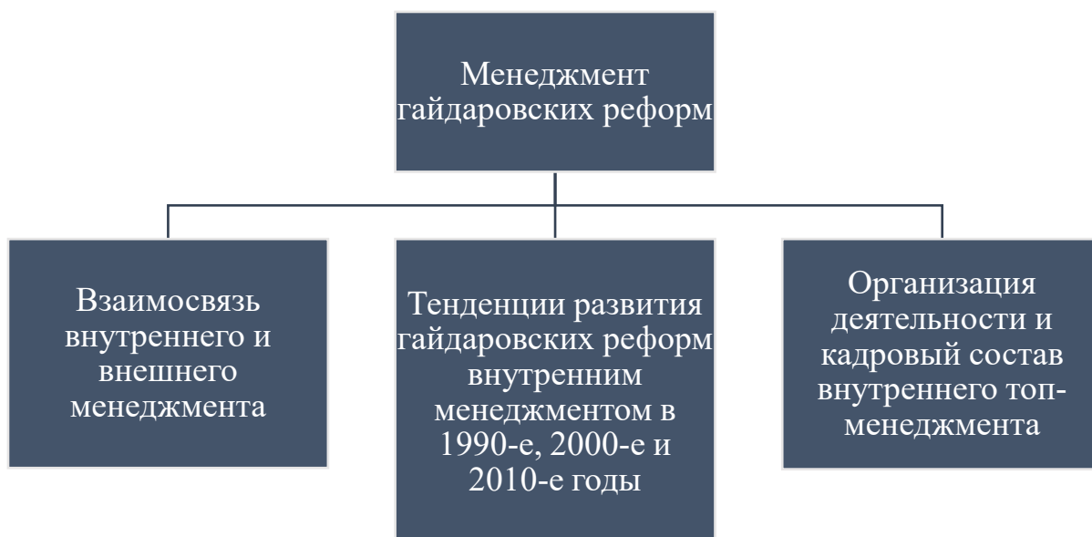
Рис. 3. Составляющие методологического анализа менеджмента разработки и реализации гайдаровских реформ [40]