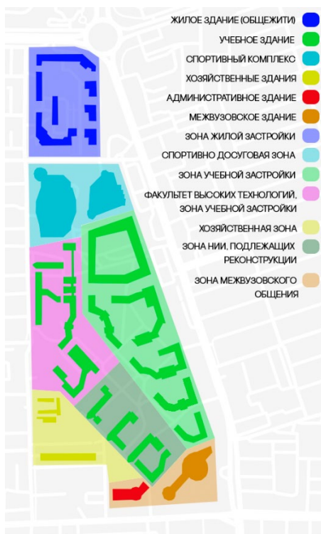
Рис. 2. Карта-схема «Генеральный план развития кампуса ЮФУ» (составлено автором)