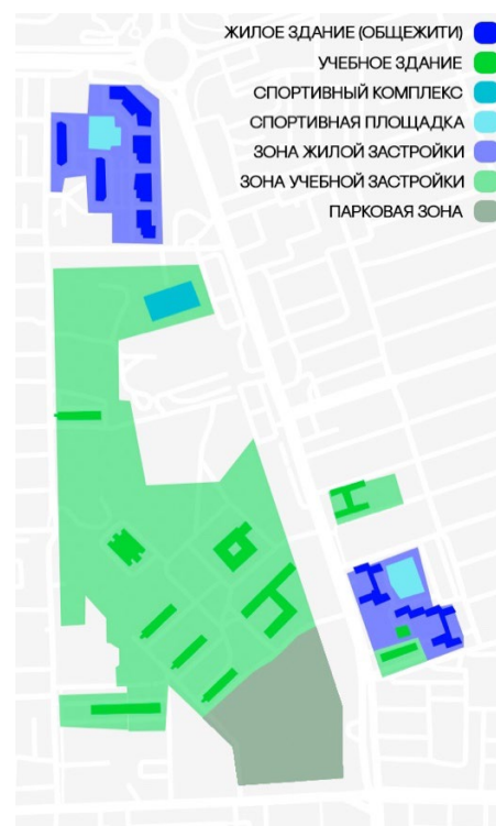
Рис. 3. Карта-схема корпусов ЮФУ в Западном микрорайоне ЮФУ на 2023 г. в г. Ростов-на-Дону (составлено автором)