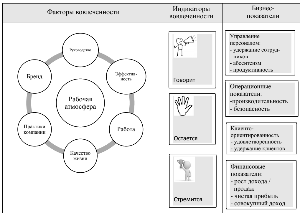
Рис. 2. Модель вовлеченности персонала Kincentric