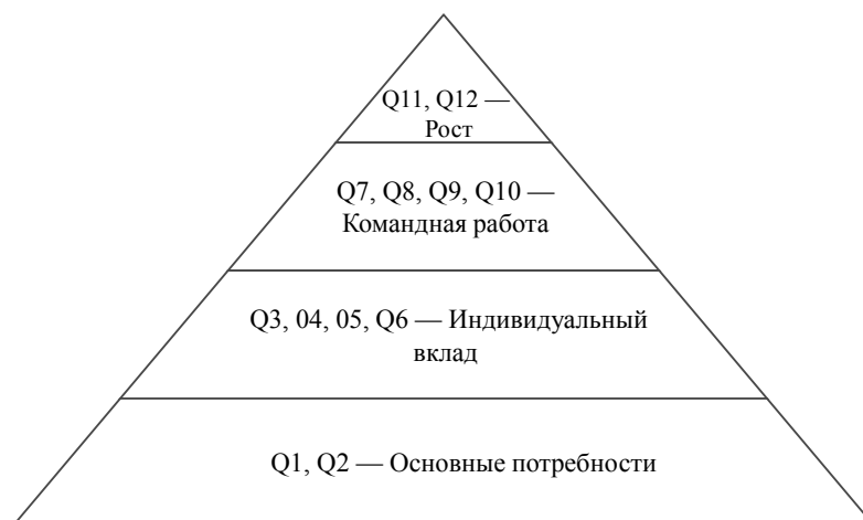
Рис. 3. Иерархия потребностей сотрудников в развитии и распределение вопросов о вовлеченности, согласно опросу Gallup

Модель вовлеченности сотрудников названа в честь ее создателя, канадского консультанта по менеджменту Дэвида Зингера. Его теория основана на многолетней практике Зингера в области психологии. Его модель фокусируется на важности связей сотрудников друг с другом, с организацией, с клиентами, с более широким сообществом и с собственной эффективностью.