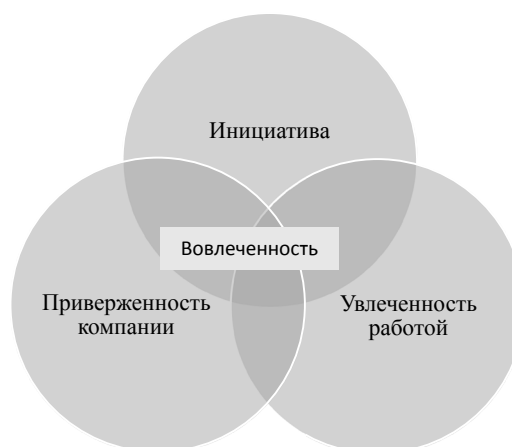
Рис. 4. Модель вовлеченности «ЭКОПСИ Консалтинг»

Российская компания «ЭКОПСИ Консалтинг» разработала свою модель вовлеченности, которая включает три базовых блока: удовлетворенность, приверженность и инициатива. Данная модель представлена на рис. 4.