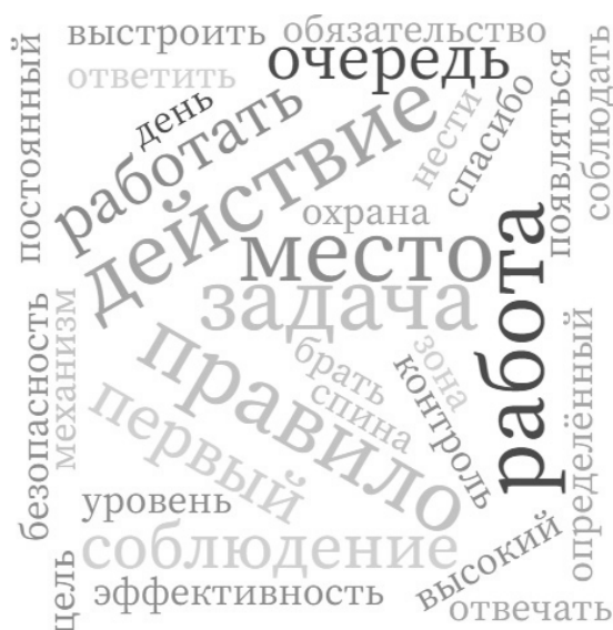
Рис. 2. Облако смыслов, построенное в сервисе «Wordcloud» по результатам ответов на вопрос «Что такое для Вас — ответственность на рабочем месте?», март 2022 г.

тельство соблюдения правил», связанных с «выполнением обязанностей и задач». При этом на вопрос «Насколько важна функция управления ответственностью персонала в организации?» абсолютное большинство респондентов отметили ее высокую значимость (71,5%).