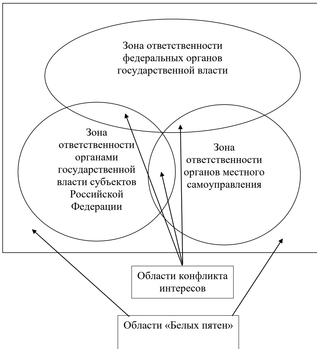
Рис. 4. Пересечение зон ответственности структурных подразделений в организации

Таким образом, реализация принципа разграничения полномочий в полном объеме - от избежания областей конфликта интересов до исключения областей «белых пятен» обязательно должна войти в новый вариант национальной модели развития системы высшего образования.