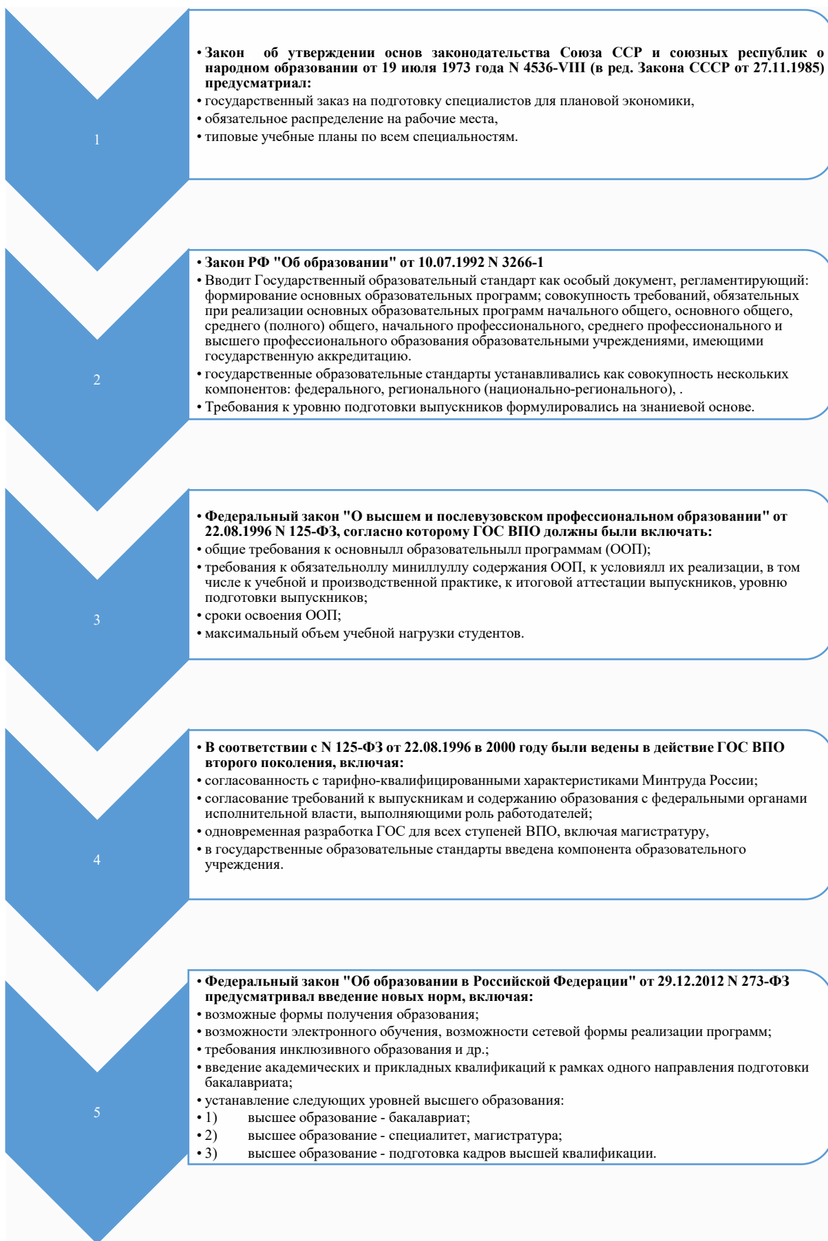
Рис. 1. Эволюция государственных образовательных стандартов высшего образования [43]