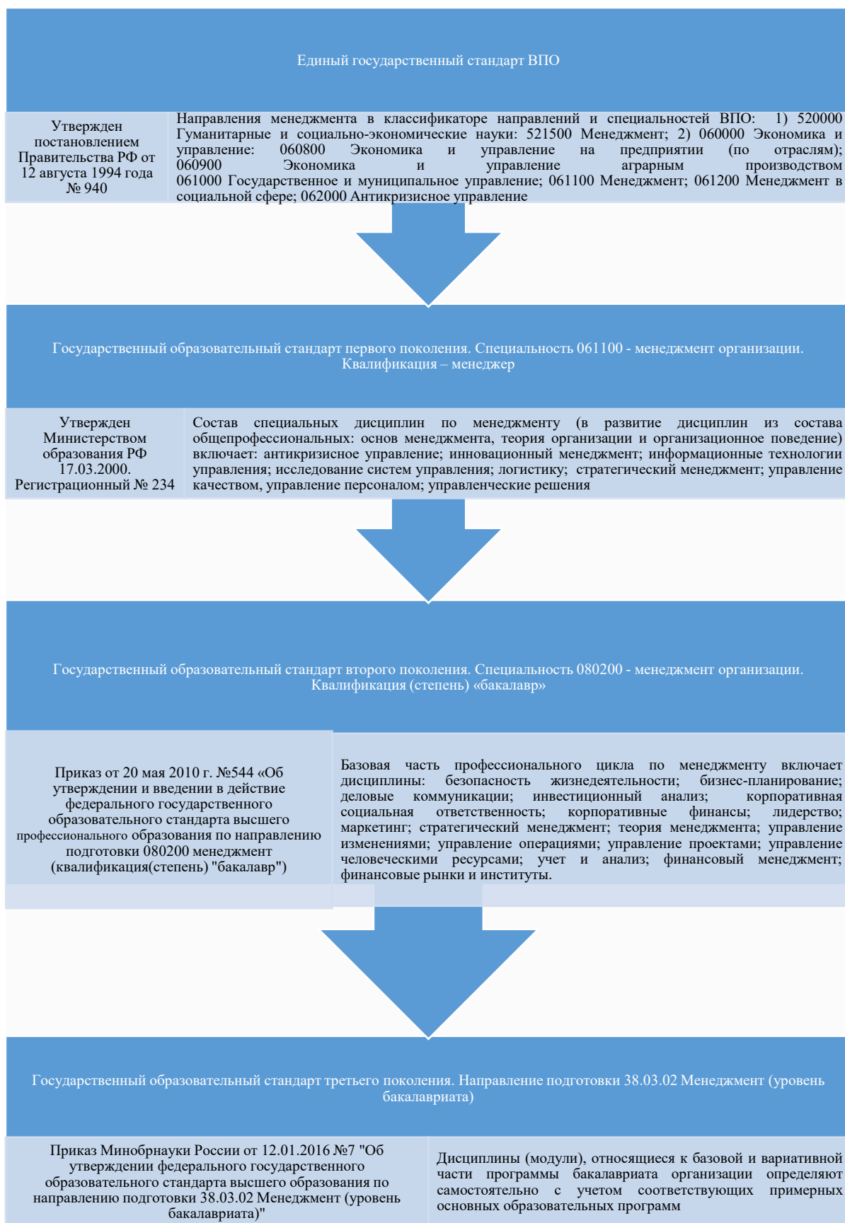
Рис. 2. Пример размывания содержания государственных образовательных стандартов в процессе их эволюции по направлению подготовки «Менеджмент» (уровень бакалавриата) [43]