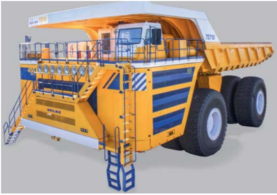
Рис. 1. БелАЗ 75710

Самым большим экскаватором в мире на сегодняшний день является экскаватор RH400 американской фирмы Terex. При весе более 1000 тонн (абсолютный рекорд) экскаватор обладает ковшем 45 куб. метров и грузоподъемностью 95 тонн. За час работы этот гигант способен выкопать и погрузить около 10 тыс. тонн породы (рис. 2).