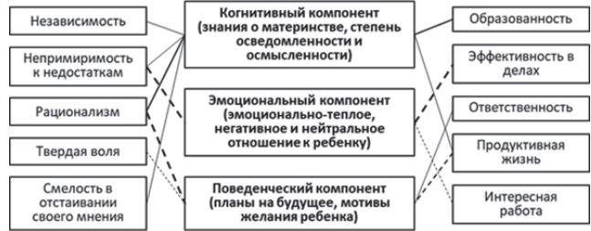
Рис. 4. Корреляционные связи между показателями индивидуалистических ценностей женщин и их психологической готовностью к материнству

ностей и сформированностью психологической готовности к материнству, причем, сами корреляционные связи характеризуются как прямым, так и обратным характером.