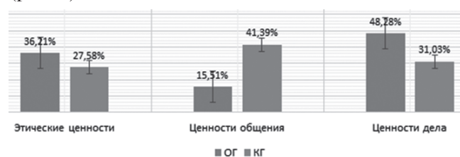
Рис. 2. Процентное распределение испытуемых двух исследовательских групп по преобладающей значимости инструментальных ценностей

Об этом свидетельствуют результаты сравнительного анализа процентных распределений респондентов основной и контрольной групп по преобладающей значимости инструментальных ценностей (рис. 2).