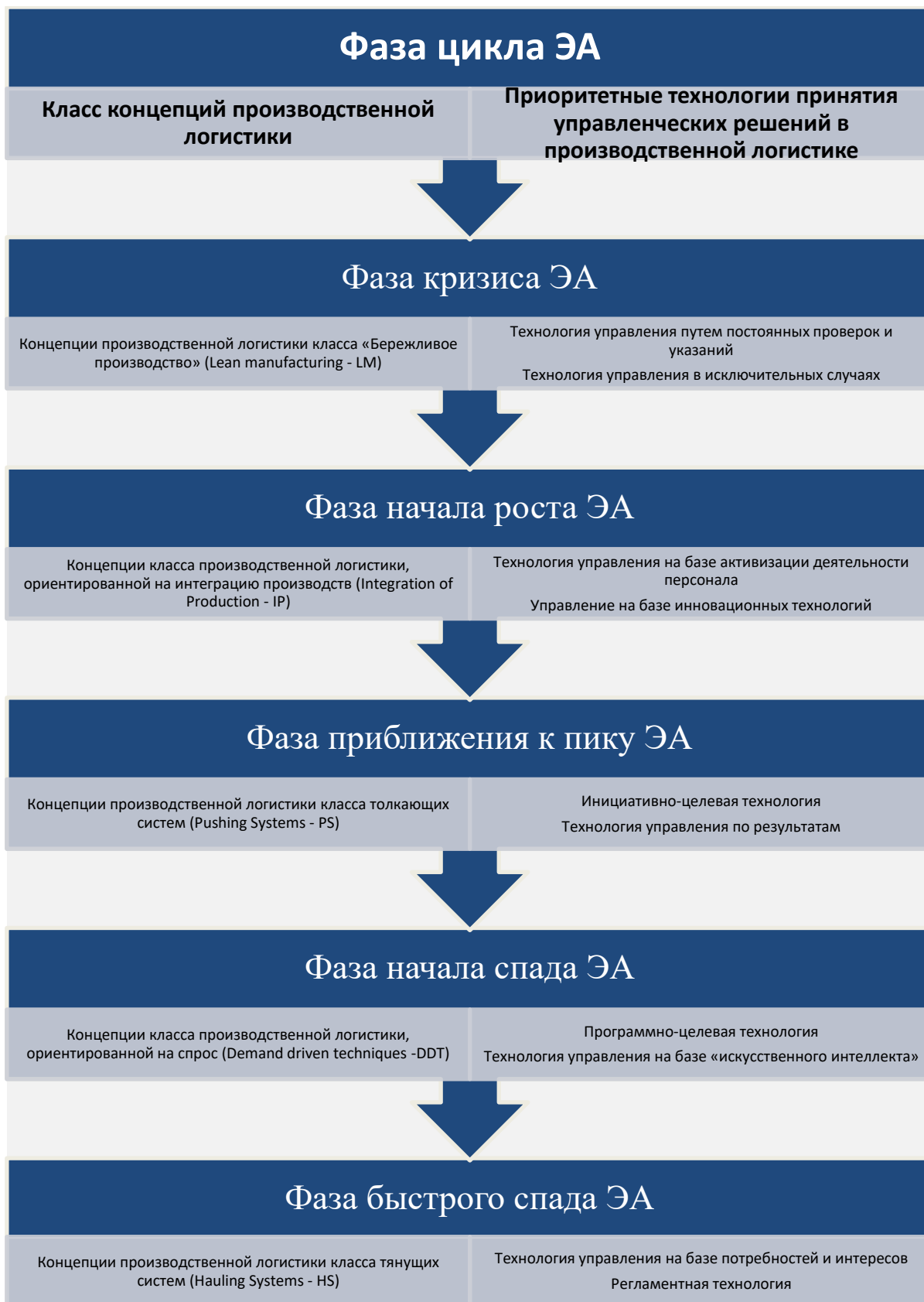
Рис. 2. Результаты синхронизации известных классов концепций производственной логистики с фазами большого цикла экономической активности Н. Кондратьева, отражающие приоритетные технологии принятия управленческих решений в производственной логистике [13]