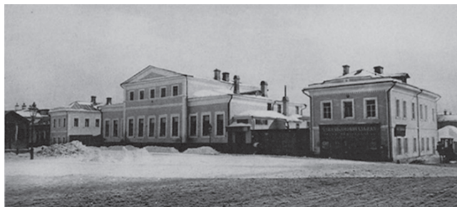
Родовой дом князя Алексея Борисовича Лобанова-Ростовского в Москве