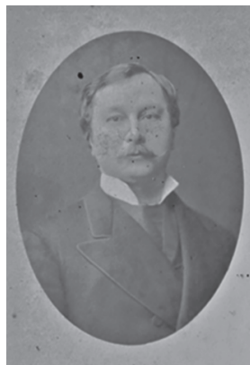
Князь Алексей Борисович Лобанов-Ростовский. Фотограф Надар. Париж. Декабрь 1879 г. Дар Никиты Дмитриевича Лобанова-Ростовского МИД РФ

«Всего за 5 лет существования РСФСР комиссия, возглавляемая Горьким, успела вывезти из России 60 тысяч тонн произведений искусств на продажу за рубежом. Эта цифра известна из информационных бюллетеней Российских железных дорог. Существует два письма Ленина, адресованных Горькому, в которых он просит его ускорить вывоз и продажу художественных ценностей, чтобы скорее выручить валюту. Эти огромные резервы, ранее бывшие достоянием российской культуры, оказались за границей. Несомненно, стоит стараться для того, чтобы постепенно возвращать это достояние на родину, что я и делаю» [11, с. 521].