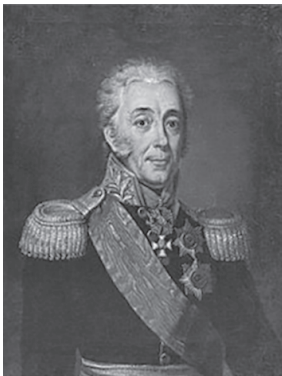
Князь Дмитрий Иванович Лобанов-Ростовский. Неизвестный худ. Дар Никиты Дмитриевича Лобанова-Ростовского посольству РФ в Париже

Род владетельных 1 князей Лобановых-Ростовских, Рюриковичей, насчитывает немало выдающихся деятелей. И первый среди них — внук великого князя владимирского Всеволода Большое гнездо — Василько Константинович Лобанов-Ростовский , удельный 2 князь Ростовский (1208–1238). Умный воевода, политик и правитель, однажды он попал в плен к монголо-татарам и отказался дать присягу в верности хану. Ему обещали милости и мучения в случае отказа, но он остался тверд, за что