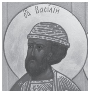
Святой благоверный князь Василько Лобанов-Ростовский