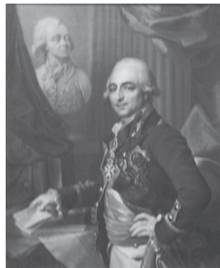
Граф Григорий Григорьевич Кушелев. Неизв. худ.