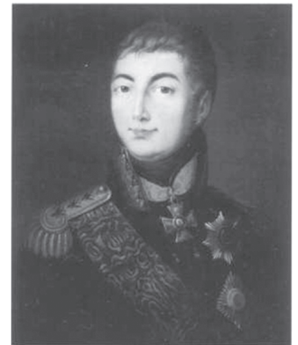
Маркиз Иван Иванович де Траверсе. Неизв. худ.

Если Музей Лобановых-Ростовских начнет свою жизнь в Ростове Великом, то помимо художественных и идейных соображений, он, несомненно, окажется привлекательным объектом для российских и зарубежных туристов и неизбежно будет содействовать материальному благополучию города.