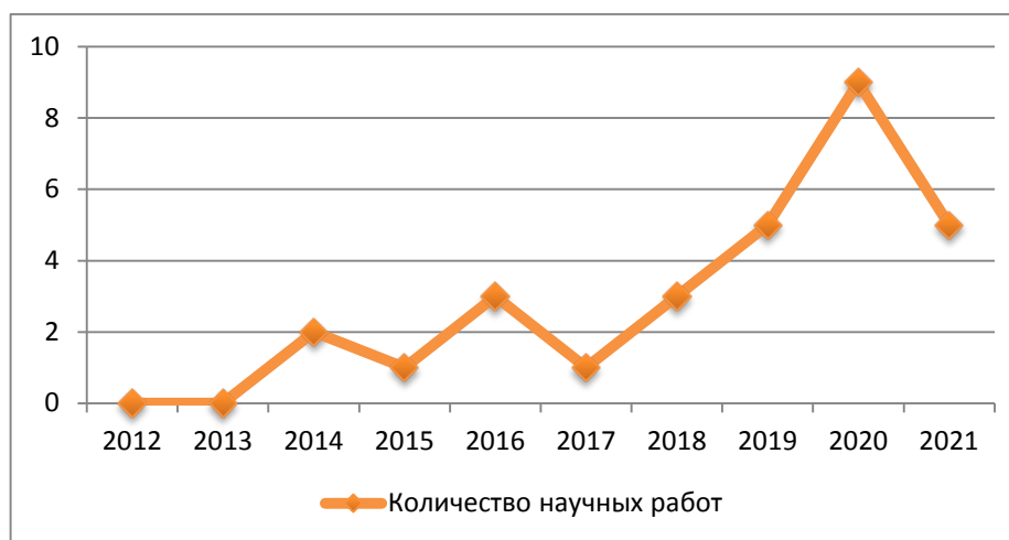
Рис. 1. Количество научных работ по годам