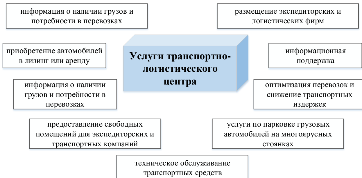
Рис. 3. Услуги транспортно-логистического центра