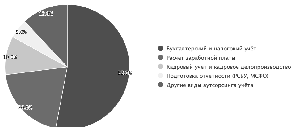
Рис. 3. Структура доходов крупнейших компаний и групп в области аутсорсинга учетных функций по итогам 2020 г. (доля, %)