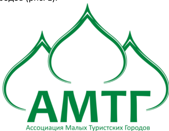
Рис. 1 – Логотип Ассоциации малых туристских городов

Подтверждением этого является создание в 2007 году Ассоциации малых туристских городов (рис. 1).