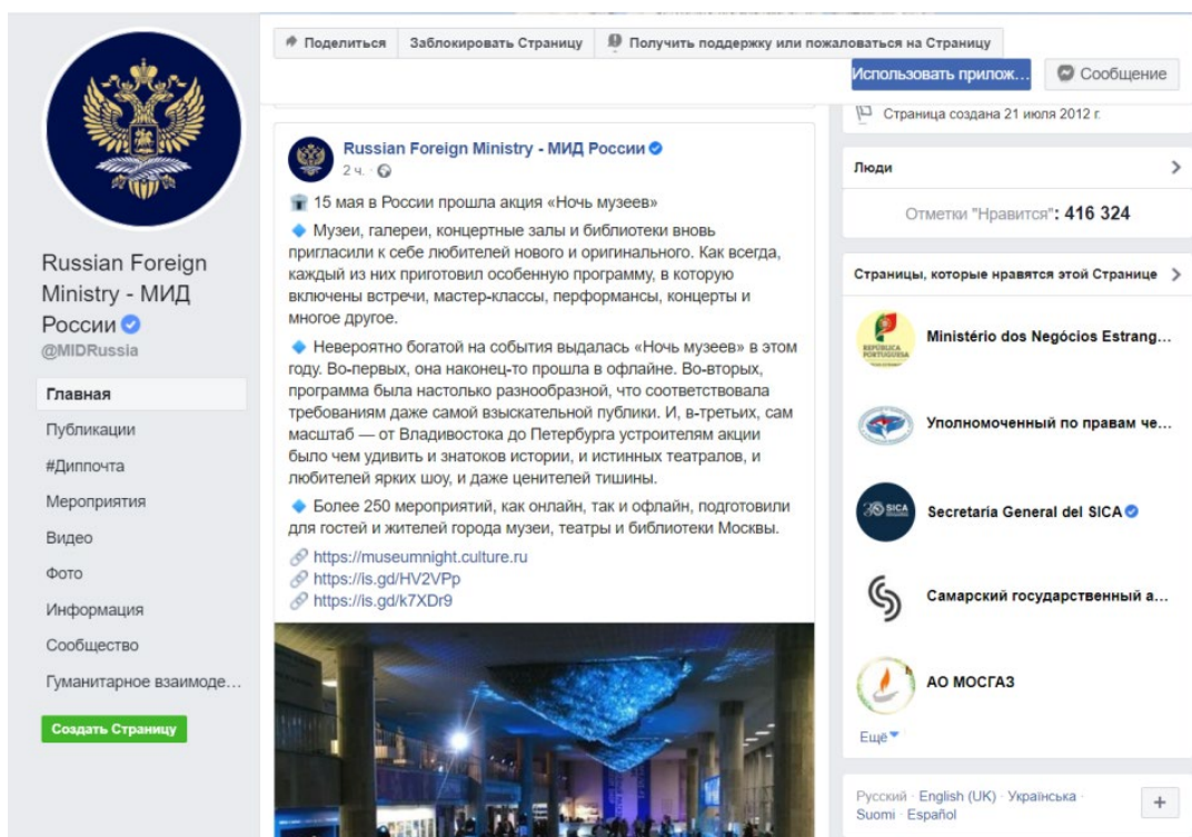
Рис. 1. Аккаунт в Facebook Министерства иностранных дел Российской Федерации 1

Схожее мнение можно встретить в работе З. Шахуда, в которой исследователь проанализировал работу дипломатических миссий Российской Федерации в сети в странах арабского мира. Анализ показал, что не все посольства и консульства имеют аккаунты в социальных сетях (Твиттер, Facebook, Instagram), и лишь малая часть из существующих аккаунтов ведут вещание на арабском языке, также как и отсутствует перевод сайтов посольств на язык региона. Таким образом, не выполняется основное условие реализации цифровой дипломатии – вещание на языке целевой аудитории [17].