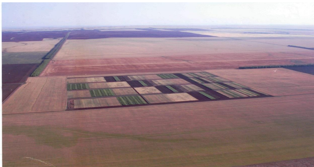
Рис. 1. Вид стационарного опытного поля с самолёта

Материалы и методы исследований. Исследования проводились в 1990-2019 гг. в «ОПХ им. Куйбышева» Оренбургского НИИСХ в системе многолетнего стационарного опыта. На опытном участке изучались шестипольные севообороты с чёрными кулисными парами под озимую рожь, озимую пшеницу и яровую твёрдую пшеницу. Длительный стационар по севооборотам с площадью 24 га размещается на чернозёмах южных Оренбургского Предуралья (рис. 1). Эксперимент проводился на многолетнем стационарном опытном поле в окрестностях поселка Крона Оренбургского района Оренбургской области.