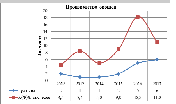
Рисунок 3 – Динамика распределения грантов и объемов производства овощей за период 2012-2017 гг.

Так, показатель, характеризующий экономическую эффективность получателей государственной поддержки, прирост производства сельскохозяйственной продукции, по направлению производства молока (67 гран-