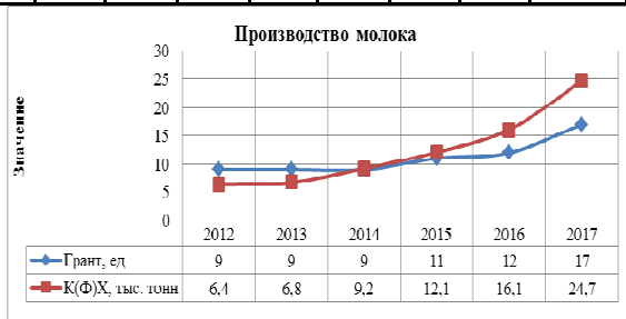
Рисунок 1 – Динамика распределения грантов и объемов производства молока за период 2012-2017 гг.

держки в Красноярском крае проведем анализ влияния выданных грантов на прирост производства продукции сельского хозяйства по каждому виду продукции: молоко, мясо (скот и птица) и овощи [13-15].