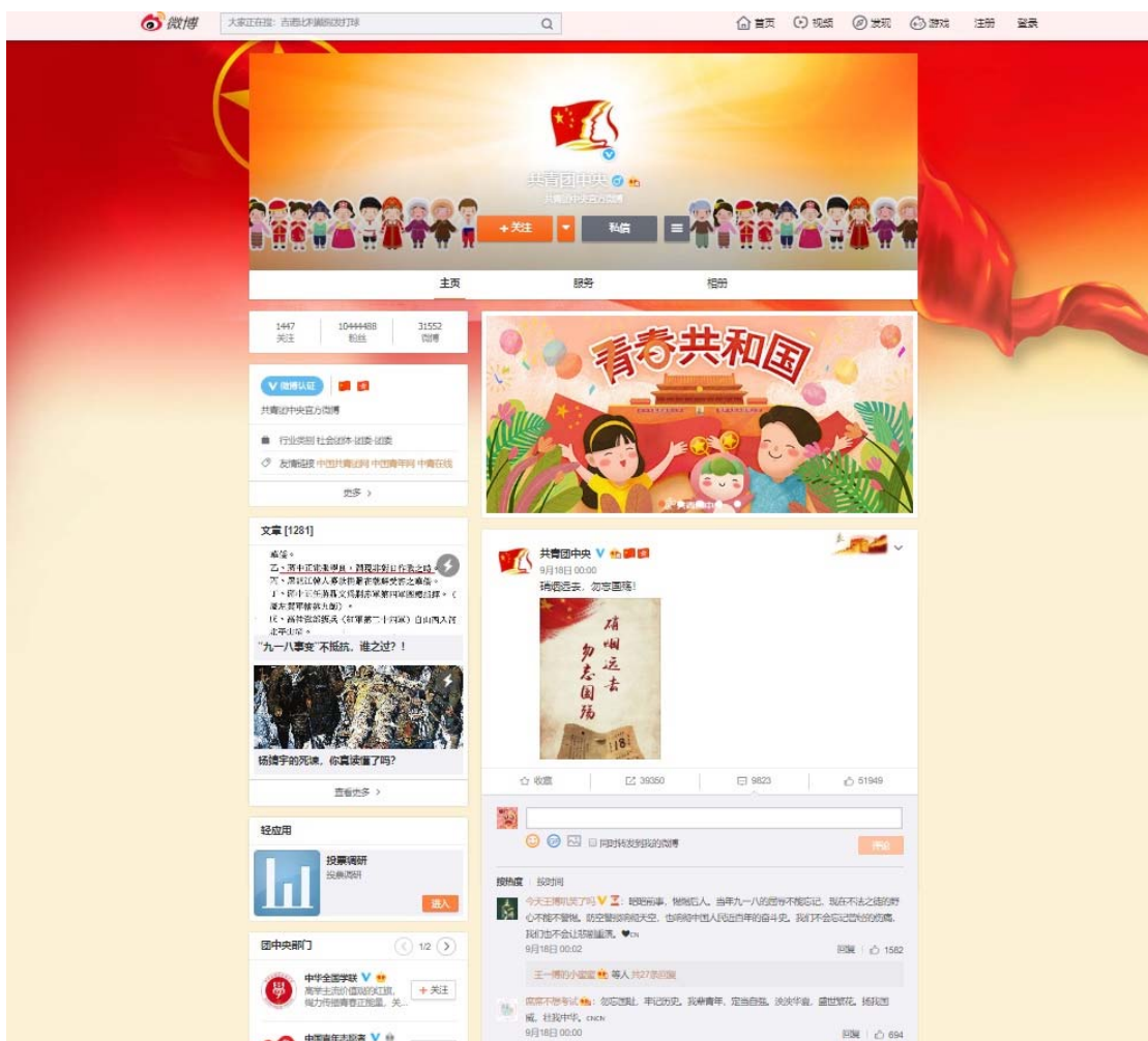
Рис. 2. Сообщество Коммунистического союза молодежи Китая [10]

Действия политического режима понятны, он старается контролировать политическую повестку и опасается использования сетевых сообществ радикальной политической оппозицией. Важно подчеркнуть, что сетевой цензурой занимается любой режим, вопрос заключается только в выявлении ее специфики, зависящей от целей и задач власти.