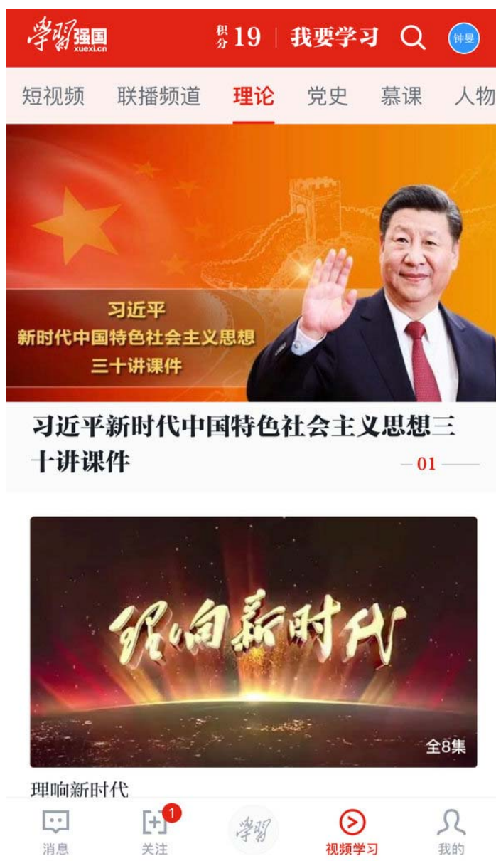
Рис. 3. Web-приложение, разработка которого была инициирована Коммунистической партией Китая [6]