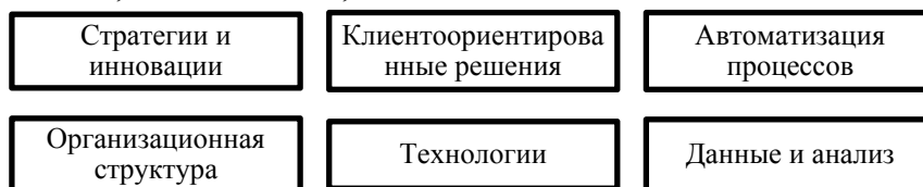
Рис. 4. Модель «Шесть кирпичей» антикризисной цифровизации МакКинзи

предусматривает перенастройку шести подсистем бизнеса [2] (рис. 4). Компании, которые успешно прошли цифровую трансформацию, должны управлять шестью блоками: стратегией и инновациями, процессом принятия решений для клиентов, автоматизацией процессов, организацией, технологиями, данными и аналитикой.