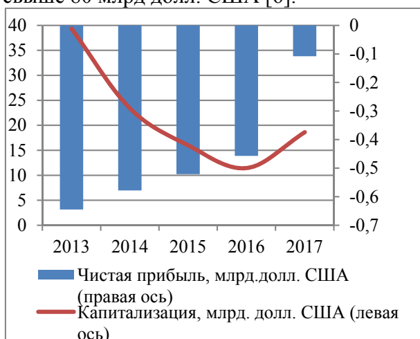
Рис. 1. Динамика капитализации и прибыльности деятельности компании TwitterInc [16]

Рыночная модель деятельности компаний нового типа не укладывается в традиционную теорию корпоративных финансов: убыточная деятельность в течение длительного времени сопровождается непрерывным ростом капитализации бизнеса (яркий пример тому компании Tesla, Twitter – см. рис. 1, 2). Яркий пример такой ситуации – компания Uber, которая перед выходом на биржу имела чистый убыток в размере 1,8 млрд долл. США при выручке в 3 млрд долл. США, достигнув капитализации в объеме свыше 80 млрд долл. США [6].