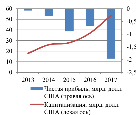
Рис. 2. Динамика капитализации и прибыльности деятельности компании Tesla [16]

Убыточные компании нового типа представляют ценность для технологических гигантов, поскольку такие компании приобретаются за существенные суммы (компания Microsoft в 2016 г. купила убыточную компанию LinkedIn за 26 млрд долл. США, компания Facebook в 2014 г. – за 19 млрд долл. США убыточную компанию WhatsApp).