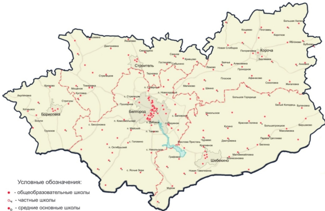
Рис. 2. Пространственное размещение общеобразовательных и средних основных школ на территории Белгородской агломерации. Сост. Буток О.В., Перькова М.В.