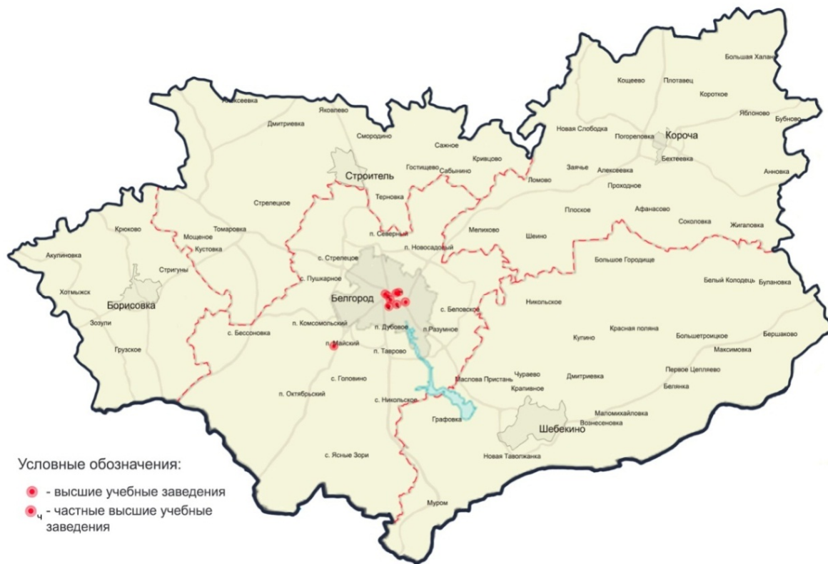
Рис. 3. Пространственное размещение учреждений СПО и ВО на территории Белгородской агломерации. Сост. Буток О.В., Перькова М.В.