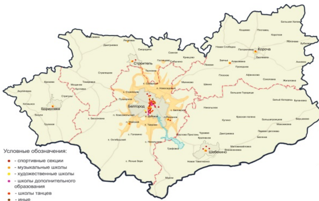
Рис. 4. Пространственное размещение учреждений дополнительного образования. Сост. Буток О.В., Перькова М.В.