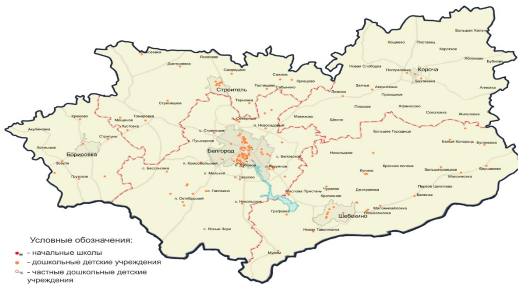
Рис. 1. Пространственное размещение дошкольных образовательных учреждений и начальных школ на территории Белгородской агломерации. Сост. Бутко О.В., Перькова М.В.