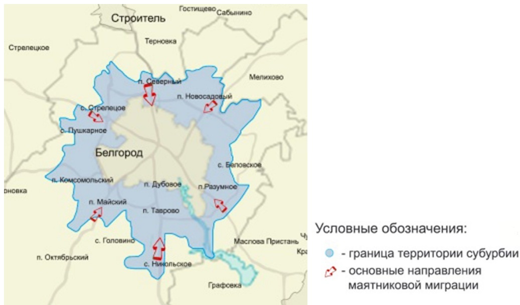
Рис. 7. Схема расположения субурбии в системе Белгородской агломерации с выявленными основными направлениями маятниковой миграции. Сост. Буток О.В.