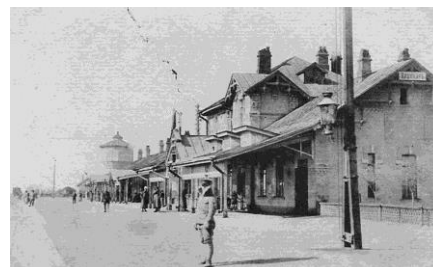
Рис. 6. Вид на западную часть вокзального комплекса станции Цицикар (фрагмент открытки)

2.3. Влияние русской станции на китайский город. С появлением станции Цицикар резко изменилось развитие китайского города. Значительные перемены произошли в пределах первой крепостной стены. Русским было разрешено строительство представительских зданий на территории старого города: департамент финансов, дом и управление генерал-губернатора, телеграф, православная церковь (рис. 9), которая