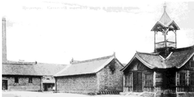
Рис. 9. Фрагмент застройки новой части города Цицикар. Китайский монетный двор и русская церковь. Фрагмент открытки

Заключение. Образование и развитие русских станций вблизи исторических городов Китая отражает особенности формирования своеобразного архитектурно-градостроительного конгломерата, основу которого определяют две культуры: России и Китая. Ярким примером этого является развитие исторического китайского города Цицикар и русской железнодорожной станции Цицикар (Аньанси). И в настоящее время в историческое наследие города входит как архитектура старого города, так и русская архитектура железнодорожного поселения.