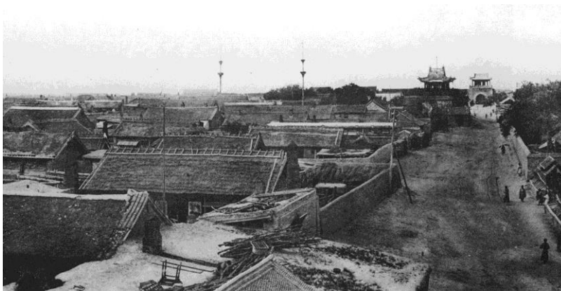
Рис. 2. Застройка старой части китайского города (фото из альбома) [11]