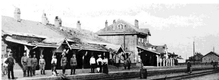
Рис. 5. Вид на восточную часть вокзального комплекса станции Цицикар (фрагмент открытки)

(рис.5), в его состав входили помещения 1 и 2 классов с уборными, буфет, телеграф, кассы, помещения для третьего класса, комната начальника участка, подсобные помещения. Павильон для китайцев был одноэтажным, с отдельным входом и выходом на перрон (рис. 6). В архитектурном отношении в качестве главного элемента комплекса выделялся центральный вход европейского павильона, который на фасаде был отмечен высоким фронтоном. Фасад формируют метрические ряды окон. Более сложное решение имел главный элемент со стороны перрона. На него накладывалась легкая деревянная конструкция пассажирского дебаркадера. Оконные проемы фасада были декорированы. Это связано было с тем, что со стороны железнодорожных путей вокзал должен был формировать образ станции. На перроне для пассажиров соорудился навес [15].