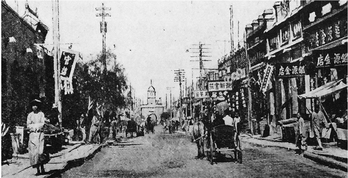
Рис. 7. Новая часть китайского города Цицикар [3]

русских. Архитектура сооружений была разнообразной. Фронт улицы формировался чередованием каменных зданий в европейских ретро стилях и традиционных китайских. Кроме жилых домов были построены общественные сооружения: школы, почта, ресторан, театр, управление железной дорогой. В северной части сконцентрированы учебные заведения: ремесленное, женское училище, учительская семинария, низовое училище [7].