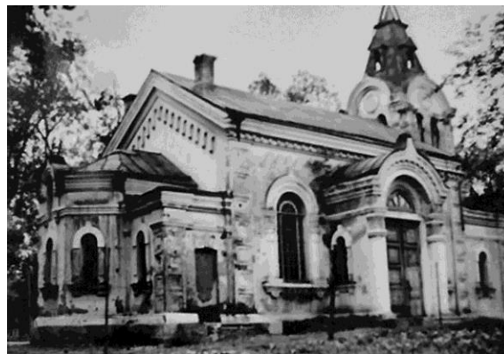
Рис. 4. Каменный храм на станции Цицикар. Фотография очевидца, 1990-е гг.

2.2. Здание вокзала. Здание вокзала Цицикара построено в 1903 г. по проекту для вокзалов второго и третьего класса, как здания на станциях Имяньпо, Яомынь, Джалантунь, Хайлар. При строительстве вокзала в проект вносились изменения, касающиеся внутренних планировок и детализировки здания.