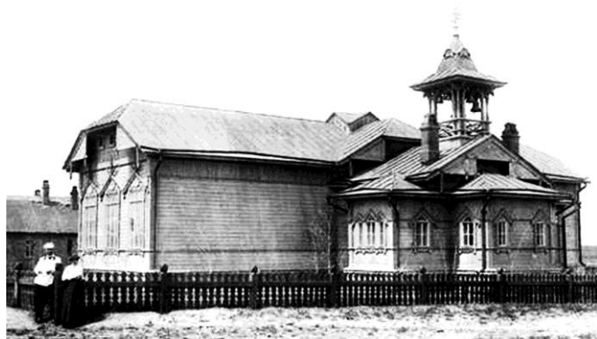
Рис. 3. Храм Святых Апостолов Петра и Павла на станции Цицикар. Фрагмент открытки